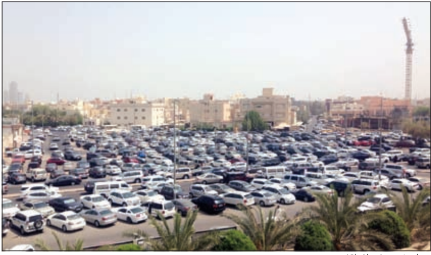
زحام شديد في المواقف