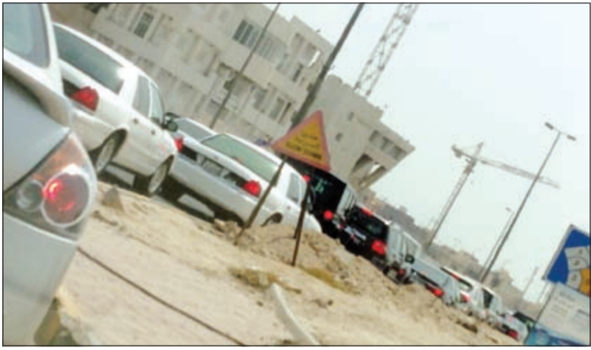
شلل مروري في محيط مرافق الجامعة

وقال مصدر مسؤول بالإدارة الجامعية إن سبب تزداد الوضع الجامعي هو الكثافة الطلابية العالية مقارنة مع قلة أعضاء هيئة التدريس ومحدودية الميادين الجامعية، موضحة أن الكثافة الطلابية المرتفعة تفقدنا السيطرة والإحكام على زمام الأمور، فكيف نوفر شعباً دراسياً أكثر إذا كان عدد الأساتذة محدوداً مقارنة مع عدد الطلبة؟ وكيف يمكننا إكمال عملية الدخول والخروج وتنظيم المرور إذا كان عدد الطلبة الداخلين والخارجين من الكليات في آن واحد يصل إلى العشرات والمئات؟