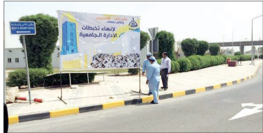
العمال يهونون بإزالة أحد إعلانات القائمة