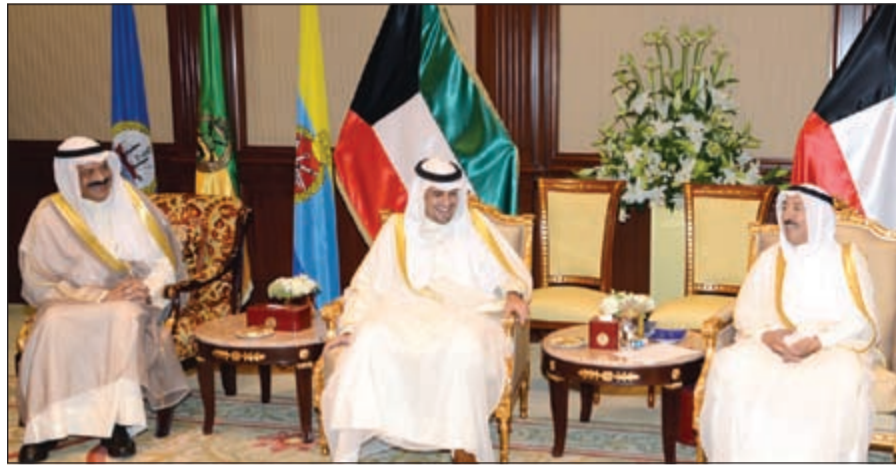
صاحب السمو الأمير مستقبلاً انس الصالح وعبدالعزیز الدخيل