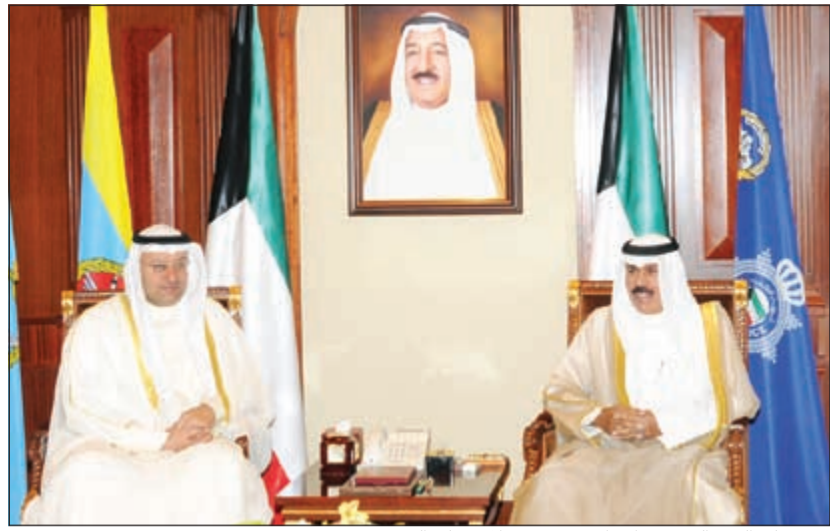
سمو ولي العهد الشيخ نواف الأحمد مستقبلاً د. علي العبيدي

العهد الشيخ نواف الأحمد بقصر بيان صباح أمس سمو الشيخ ناصر المحمد. واستقبل سموه بقصر بيان صباح أمس نائب رئيس مجلس الوزراء ووزير المالية انس الصالح حيث قدم لسموه عبدالعزيز الدخيل وذلك بمناسبة تعيينه رئيساً لجهاز الرقابة المالية. كما استقبل سمو ولي العهد الشيخ نواف الأحمد بقصر بيان صباح أمس وزير الصحة د.علي العبيدي.