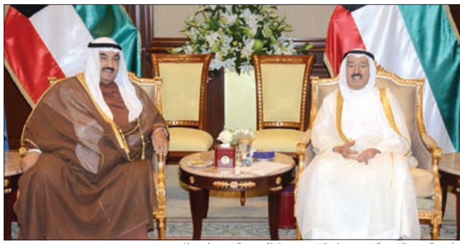
صاحب السمو الأمير الشيخ صباح الأحمد مستقبلاً سمو الشيخ ناصر المحمد