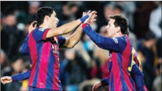
نجي برشلونة ميسي وسواريز

وانهى سواريز حواراه بالحديث عن الفرق بين ما عاشه في ليفربول وما هو عليه الآن مع برشلونة: «إذا جئت هنا، فذلك لأقاتل وليس لشيء آخر. أشعر بضغط أقل مع برشلونة على عكس ما كان في ليفربول، حيث كنت ملزماً بالاعتماد على نفسي لتحسين مستوى أداء الفريق وعندما كنا نخسر كانت دائماً الانتقادات توجه لي».