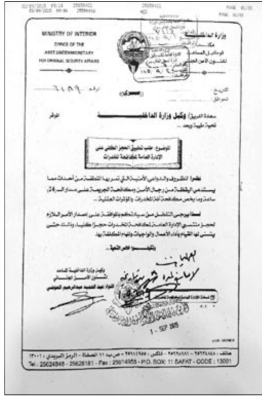
صورة زكوغرافية من الكتاب الذي اعتمده الفريق الفهد

هذا، ووافق وكيل وزارة الداخلية على الكتاب بهذا الخصوص واعتمده.