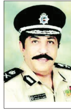
اللواء عبدالحميد العوضي