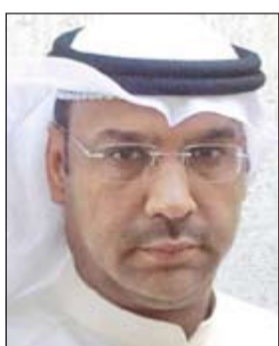
العميد محمد الشهران

أحال مدير مباحث الفروانية الى النيابة العامة وافدا عربيا يدعى «ح.نسيم» بعد ضبطه متلبسا ببيع المواد المخدرة، وذلك عقب تعليمات صدرت اليه من قبل مساعد مدير عام الادارة العامة للمباحث الجنائية لشؤون المحافظات