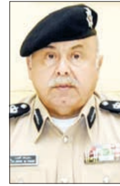
الفريق سليمان الفهد