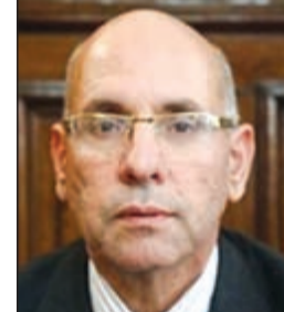
وزير الزراعة المستقيل صلاح هلال

القاهرة - وكالات: قرر الرئيس المصري عبدالفتاح السيسي إقالة وزير الزراعة د.صلاح هلال، بسبب قضية الفساد الكبيرة التي كشفتها الأجهزة الرقابية، وتورط فيها عدد كبير من الشخصيات العامة والمشاهير، بحسب وكالة أنباء الشرق الأوسط الرسمية. وبناء على توجيهات السيسي، استقبل رئيس مجلس الوزراء م.إبراهيم محلب وزير الزراعة الذي تقدم باستقالته من منصبه.