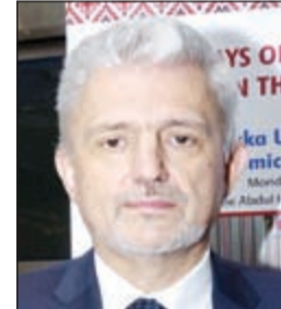
السفير الأوكراني فلاديمير تولكاش

تُمنّ سفير أوكرانيا لدى الكويت فلاديمير تولكاش العلاقات الأوكرانية - الكويتية والتي وصفها بالمتعمدة، مشيداً بدور الكويت في مجال العمل الإنساني خصوصاً بعد تسمية الأمم المتحدة لصاحب السمو الأمير الشيخ صباح الأحمد قائداً إنسانياً، وتسمية الكويت مركزاً للعمل الإنساني. وكشف السفير في تصريحات خاصة لـ «الأنباء» عن دخول اتفاقية إعفاء الكويتيين من التأشيرات حين التنفيذ، مؤكداً أن بلاده تقدم تسهيلات ودعمًا استثمارياً للراغبين في الاستثمار في أوكرانيا من رجال الأعمال الكويتيين في القطاعين العام والخاص، مؤكداً حرص بلاده على تيسير وتسهيل الإجراءات للمستثمرين الأجانب.