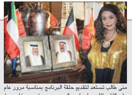
منى طالب تستعد لتقديم حلقة البرنامج بمناسبة مرور عام على اللفظ الأمامي لصاحب السمو (محمد خلوصي)