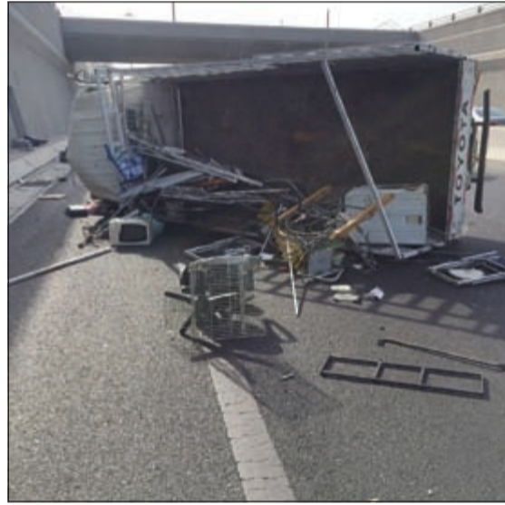
الهاف لوري تبعرت محتوياته بعد الانقلاب