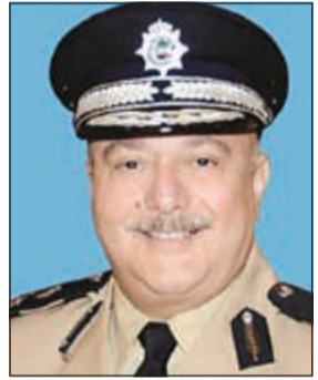
اللواء ركن شهاب الشمري