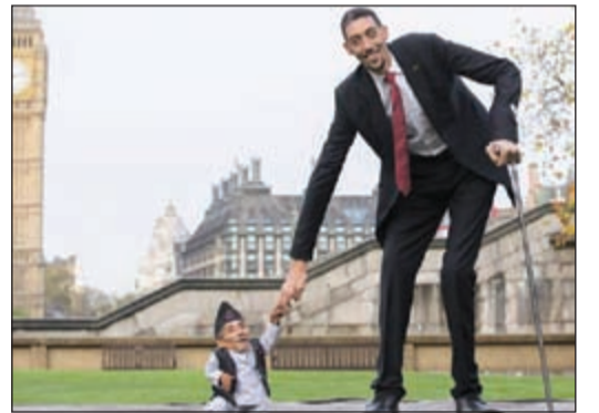
صورة تذكارية تجمع أطول رجل في العالم والأقصر الذي توفي

لندن - أ.ش.أ: أعلنت موسوعة غينيس للأرقام القياسية وفاة أقصر رجل في العالم، تشاندرا بهادور دانجي، نيمالي الجنسية عن عمر يناهز 75 عاماً، وذلك بأحد مستشفيات جزر ساموا الأميركية، ونكرت قناة «سكاي نيوز» الإخبارية أنه لم يتم حتى الآن الاعلان عن سبب وفاة تشاندرا الذي يحمل لقبين في موسوعة غينيس للأرقام القياسية كأقصر رجل في العالم وأقصر رجل تم تسجيل طوله على الإطلاق. وكان تشاندرا الذي يبلغ طوله 54,6 سم نال لقب أقصر رجل في العالم من قبل الموسوعة في فبراير 2012.