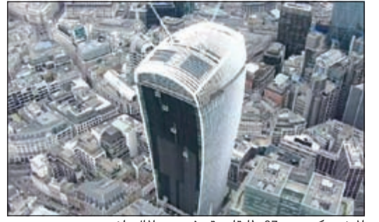
المبنى مكون من 37 طابقا ويقع في حي المال بلندن

لندن - رويترز: حصلت ناطحة سحاب في لندن تصدرت عناوين الاخبار حين أدت أشعة الشمس المنعكسة على سطحها الى انصهار اجزاء من سيارة جاغوار كانت تقف في الشارع على جائزة كاس «كارينكل» التي تقدم سنويا لأسوأ تصميم معماري. والمبنى المكون من 37 طابقا في حي المال بالعاصمة لندن يحمل اسم «20 فينتشرش ستريت» وكان يطلق عليه «ووكي توكي» أي «جهاز الاسلكي» بسبب شكله المنحني، لكنه بعد حادث صهر السيارة في 2013 حمل لقباً جديداً «ووكي سكورتشي» أو «الجهاز الحارق».