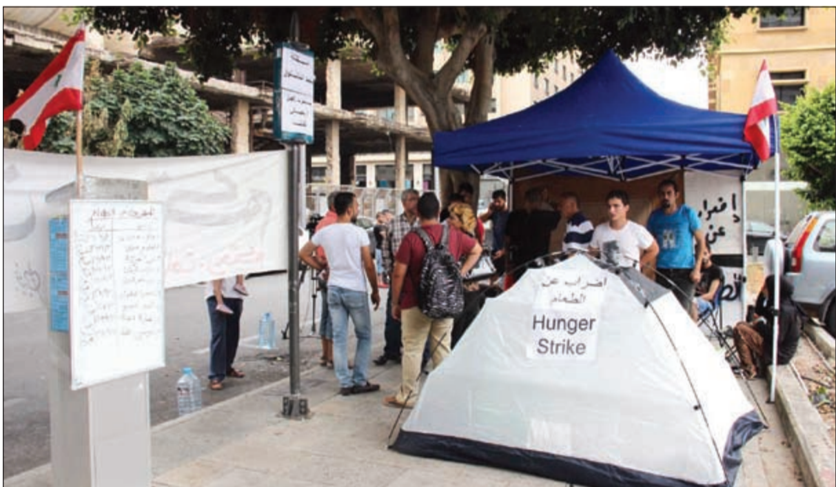
المتصمون يواصلون الاضراب عن الطعام في محيط وزارة البيئة رغم تدهور صحة أحد المضربين ونقله الى المستشفى (محمود الطويل)

مصادر رئيس الحكومة تمام سلام قالت ان زيارة سفراء الدول الخمس دائمة العضوية في مجلس الأمن إلى السراي اثبتت ان هناك إجماعا على دعمه الحكومة السالامية دون تردد، تأكيدا على التمسك باستقرار لبنان بمعزل عن الحراك الشعبي القائم. في حين أكد امس نائب الأمين العام لحزب الله الشيخ نعيم قاسم على تبني الحزب العماد عون لرئاسة الجمهورية. ربيع عربيا في لبنان، أشدد في تصريح له على أن يظل الحوار سائدا بين اللبنانيين حتى يحسن اوان الاتفاق فيما بينهم سواء أتى من الخارج أو من الخارج والداخل. ونقلت عنه صحيفة