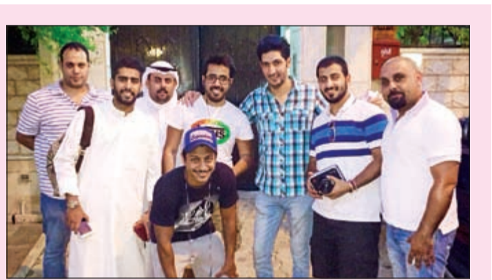
الشعبي وبهبهاني في كواليس الاغنية