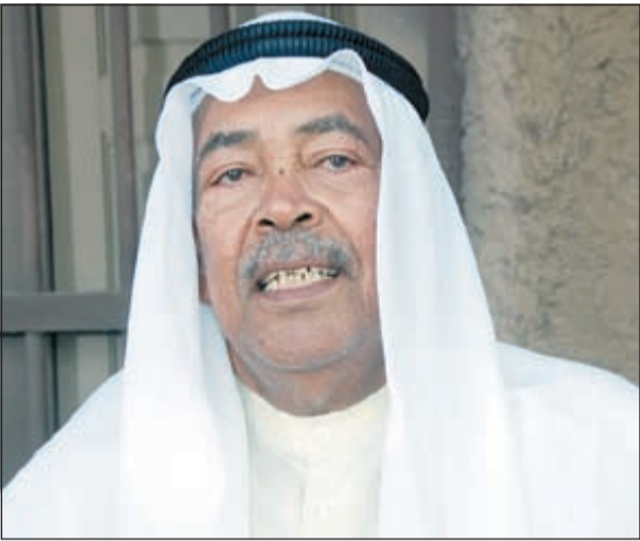
الفنان الكبير سعد الفرج

الفرج بالنص المكتوب، قال الصبر: الفرغ فنان كبير، والممثل يعيش الدور والحدث والقصة، ويتصرف بطبيعة الشخصية وممثل بقامة يعتبر مدرسة، وهو سيحافظ على النص وإضافاته ستفري العمل حتما، لافتا إلى أن النص رسم قبل توزيع شخصيات العمل، وأن اعتذار الممثلة السعودية مروة محمد كان سلسلا لظروف معينة منعتها عن المشاركة ودورها الغي من العمل. فيما تحدث أبطال المسرحية عن مشاركتهم، فقال الفنان السعودي بشير غنيم أنه سيدعم