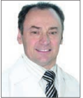
د. إيمانويل ماسميجيان

استقبال مستشفى السلام الدولي د. إيمانويل ماسميجيان في زيارته التي تستمر 3 أيام فقط، خلال الفترة من 12 وحتى 14 سبتمبر 2015، وذلك ضمن إطار خطة المستشفى الخاصة بالأطباء الزائرين وحرصه على توفير أفضل الخدمات المتاحة في عالم العلاج الطبي لعملائه، من حيث استضافة كفاءات عالمية لها تأثيرها الكبير في عالم الطب. ود. إيمانويل ماسميجيان هو بروفيسور جراحة العظام ورئيس قسم جراحة الكتف وأعصاب الطرف العلوي واليد في مستشفى جامعة باريس، تخصص دقيق في جراحات الكتف وأعصاب الطرف العلوي واليد والكسور الحديثة وغير المتضمنة وحالات اختناق أعصاب اليد والخشونة وقطع أوتار الكتف وحالات تيبس الكتف وحالات اختناق الأوتار.