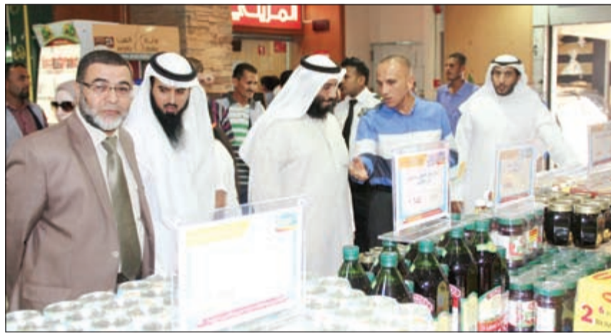
جولة على الأصناف المشمولة بالتخفيضات

من الأصناف المميزة من السلع الاستهلاكية والغذائية الأكثر طلباً من قبل المستهلكين، تم عرضها في الأسواق المركزية الأربعة مع الالتزام بتوفير الكميات حتى نهاية فترة التخفيضات. وأشار إلى أن مهرجان الخضار والفاكهة لايزال متالقاً يوم الإثنين من كل أسبوع ويشهد نشاطاً مميزاً في حركة المبيعات نظراً لتوافد عدد كبير من المستهلكين من خارج المنطقة بحكم السمعة الطيبة التي حققتها جمعية صباح السالم التعاونية خلال السنوات الأخيرة، إلى جانب المهرجان التسويقي الذي يتم إنطلاقه شهرياً في الأسواق المركزية على مجموعة من الأصناف الاستهلاكية والغذائية في حين جار الاستعدادات لتنظيم مهرجان ضخم على مستوى الكويت للوازم البر والرحلات الاستفادة من هذه العروض على انتقاء مجموعة