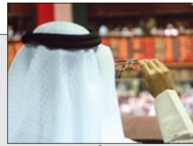
أين الفرص في الأسهم الآن؟