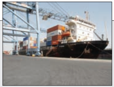
عمليات الإنساح في ميناء الشويخ تتم بسرعة قياسية مع اتباع كامل الإجراءات الأمنية

مساعد ندا لـ «الأنباء»: «الزرق» أهم من مستقبلي! 38