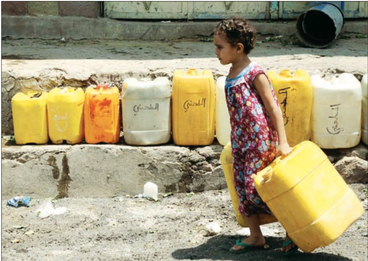
طفلة يمنية أثناء توجيهها للحصول على مياه من أحد الاماكن العامة في تعز أمس الاول

دائم وشامل لإطلاق النار من جميع الأطراف وانسحاب كل الجماعات والمليشيات المسلحة من المدن وفقاً لآلية تؤدي إلى سدد الفراغ الأمني والإداري والوعي الحصار البري والبحري والجوي. من جهته، أكد نائب الرئيس اليمني ورئيس الوزراء خالد بحاح أن عملية السهم الذهبي لن تتوقف حتى استعادة السيطرة على كل المحافظات اليمنية دون استثناء. ونفى بحاح، في مقابلة مع قناة «العربية»، مسؤوليته عن وقف زحف عملية السهم الذهبي إلى تعز، شارحاً أن العملية تجري وفق خطة عسكرية مشتركة مع دول التحالف العربي بقيادة المملكة العربية السعودية. وشدد على أن استعادة السيطرة على صنعاء ستستغرق ساعات مئى ما وجدت العزيمة اللازمة لذلك، مشيراً إلى تعقيدات الوضع في المدينة، وحرص الحكومة على عدم تحويلها إلى ساحة حرب حفاظاً على سكانها وتاريخها. ونفى بحاح التصريحات التي تحدثت عن نية الحكومة الإبقاء على عدن كعاصمة لليمن خلال السنوات الخمس المقبلة، مؤكداً عزم حكومته على ممارسة أعمالها بالتوالي بين عدن وصنعاء بعد تحريرها من قبضة مليشيات الحوثي وصالح.