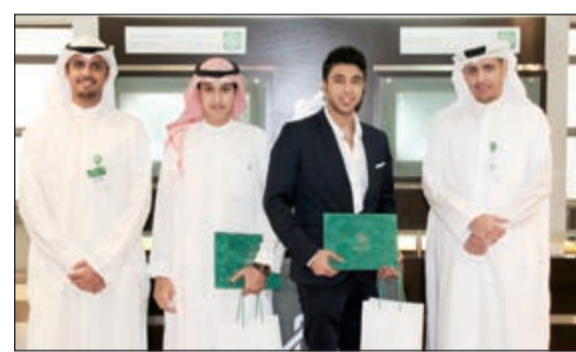
بعض المتدربين في ختام البرنامج

بالتعاون مع برنامج لوباك، مؤكدين انها ساهمت في تطوير مهاراتهم الشخصية والعملية، من خلال التعامل مع الجمهور والعملاء وتجربة الحياة العملية المقبلين عليها قريباً. وأشاد المتدربون بما لمسوه من تعاون ومساعدة من جميع العاملين وما توافر لهم من خبرات وتجارب ومعلومات عن أنشطة متعددة، شملت جوانب العمل المالي والاستثماري والمصرفي، وهو ما يميز «بيتك» ويجعله بيئة مثالية للعمل والتدريب تتيح كما كبيرا ومتنوعاً من المعرفة في أكثر من نشاط نظراً لعمل «بيتك» في مجالات كثيرة، علاوة على التنوع في الخبرات بين السوق المحلي والأسواق الدولية من خلال فروعه الخارجية التي تعمل في أسواق مهمة ذات ارتباط وثيق بحركة التجارة والاقتصاد في العالم.