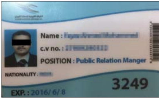
الهوية الخاصة بشركة الطيران