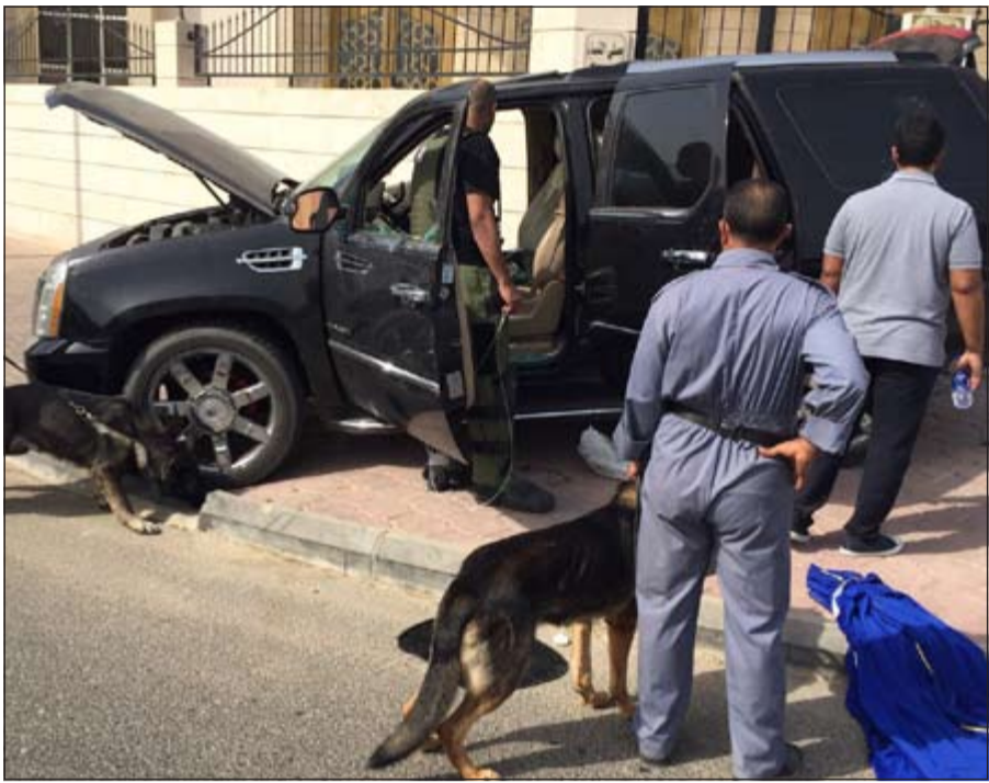
رجال المتفجرات وكلاب الاثر خلال تعاملهم مع المركبة المشتبه بها