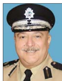
اللواء ركن شهاب الشمري