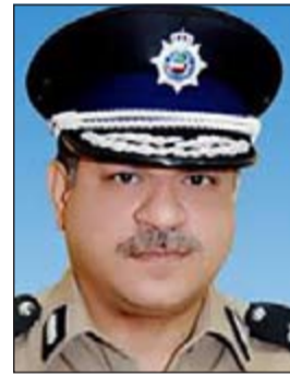
اللواء جمال الصايغ