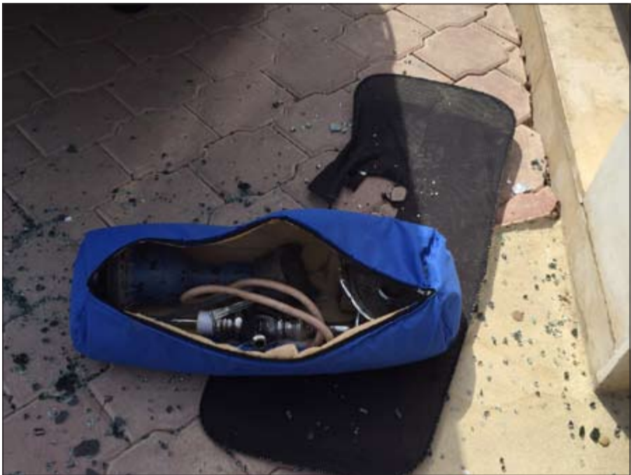
شنطة اثار حفيظة رجال الامن لدى مشاهدتها في السيارة

الداخلية تلقت بلاغا بوجود مركبة مشتبه بها في مواقف مسجد عمر بن الخطاب في منطقة الدسمة وتبين ان السيارة اميركية الصنع وتعود لمواطن، وتم التعامل مع المركبة بواسطة تقنيات خاصة بالمتفجرات وتسجيل اثبات حالة.