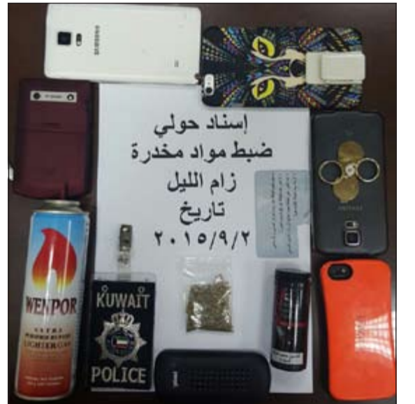
المخدرات المضبوطة في حولي