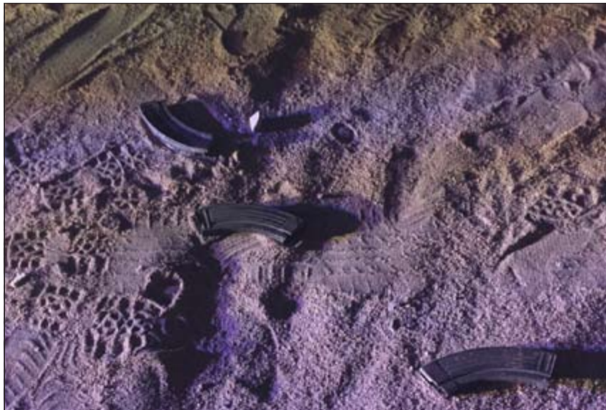
الذخيرة التي عثر عليها على الدائري السادس

نقل 3 اشخاص (عراقي ومصري واردني) الى الإدارة العامة لمكافحة المخدرات على ان يحال العراقي الى ادارة الابعاد تنفيذا لقرار الادارة العامة للمرور بشأن ابعاد كل من يقود سيارة من دون رخصة سوق. وبحسب مصدر امني، فإن دورية تتبع الامن العام وخلال جولة لها في منطقة السالمية رصدت مركبة يتجاوز قائدها الخطوط الارضية، ليطلب منه رجال الامن التوقف، ولدى طلب رخصة القيادة تبين للأمنيين انه لا يحمل رخصة سوق وهو عراقي الجنسية وبرفقته مصري واردني، وبدا على مرافقي العراقي الارتباك، ليتم تفتيشهما والعثور بحوزتهما على مواد مخدرة. وعليه، تم اخطار مدير امن حولي اللواء ركن شهاب الشمري والذي يبلغ وكيل وزارة الداخلية المساعد لشؤون الامن العام اللواء عبدالفتاح العلي ليأمر