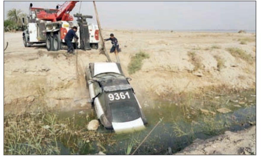
الدورية لدى انتشالها من الحفرة بواسطة ونش

بوجود حفرة مائية كبيرة بعرض الطريق فسقط فيها، فيما تفادى الشخص المطارد صباحا، رصدت مركبة رباعية الدفع بيضاء اللون، فانطلقت الدورية لمعرفة اسباب وجودها في المحمية، الا ان قائد المركبة هرب، وخلال مطاردة الدورية للمركبة فوجئ قائد الدورية