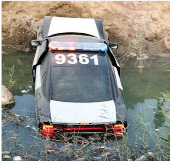
الدورية وقد كادت المياه ان تغمرها