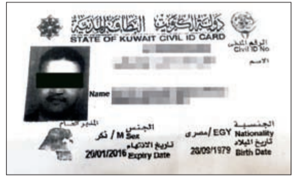
البطاقة المدنية المزورة

استخدم الهويات المزورة في المطار لعدة مرات. هذا وأمر وكيل وزارة الداخلية المساعد لشؤون العمليات اللواء زهير النصرالله بإحالة الوافد الى المباحث الجنائية.