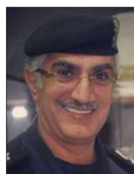
اللواء ابراهيم الطراح