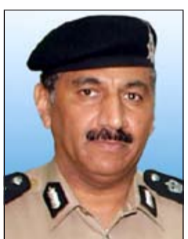
اللواء فهد الشويخ