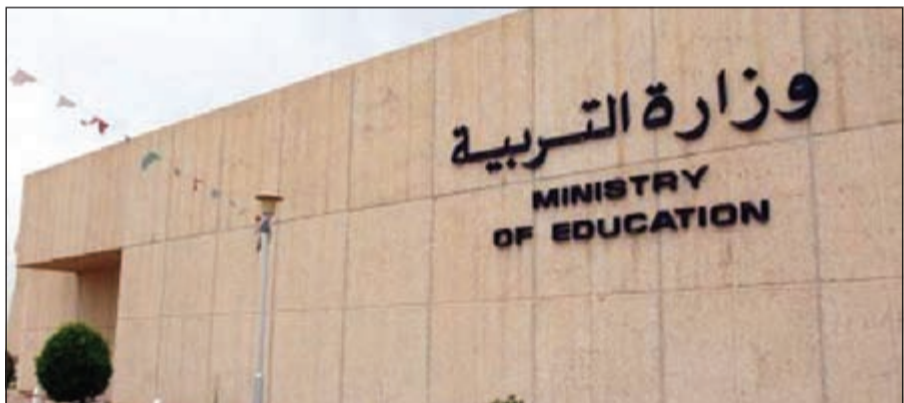
جهود كبيرة لوزارة التربية استعدادا للعام الدراسي الجديد

التنفيذ أو أثنائه بما يحقق حسن سير العمل ومتابعة أعمال اللجان الفرعية لتنفيذ المشروعات وكذلك التنسيق مع فريق إعداد ومتابعة الخطة بوزارة التربية وتوفير متطلبات المتابعة من نماذج وتقارير في المواعيد المحددة.