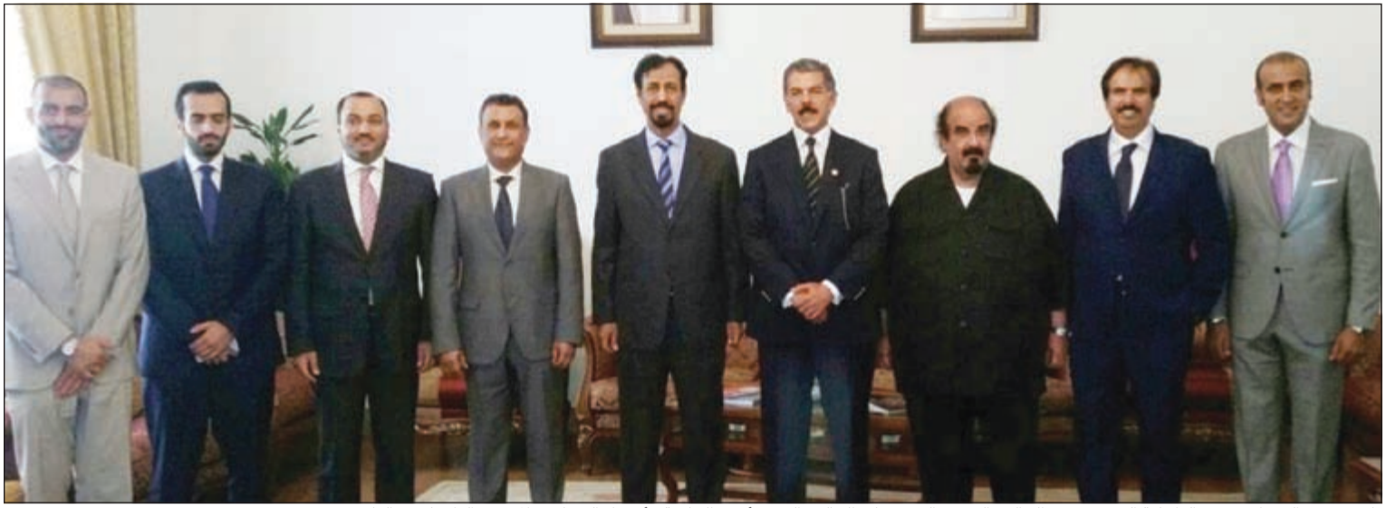
نائب رئيس الوزراء وزير الداخلية الشيخ محمد الخالد والسفير الشيخ علي الخالد والشيخ أحمد الخليفة وأعضاء السفارة والمندوب الدائم لدى «الفاو»

وكان في رفقة الشيخ محمد الخالد خلال الزيارة وكيل وزارة الداخلية المساعد للشؤون المالية والإدارية اللواء الشيخ أحمد الخليفة.