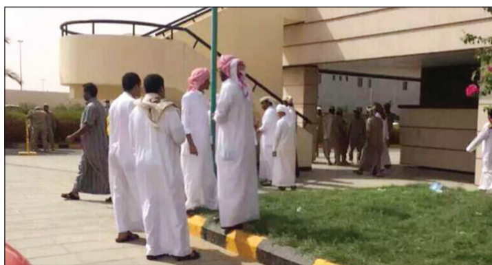
سعوديون في مستشفى شرورة في جيزان يستعدون للتبرع بالدم لإغاثة إخوانهم الإماراتيين المصابين في انفجار مارب بعد نقلهم إلى المملكة

عواصم - وكالات: أعلنت دولة الإمارات العربية المتحدة أمس عن استشهاد 22 من جنودها المشاركين في التحالف العربي ضد المتطرفين الحوثيين في اليمن. وقال وزير الدولة للشؤون الخارجية في الإمارات د.أنور قرقاش: «صاروخ أرض أرض، وانفجار مستودع الذخيرة استهدف الشهداء (...). أداء قواتنا المسلحة مستمر وتحرير مارب قريب بإذنه تعالى». وأضاف في سلسلة تغريدات عبر حسابه على «تويتر»: «استشهاد أبنائنا يزيدنا قوة وإصراراً على إتمام المهمة. أرواحهم ودمائهم تزيدنا عزماً والتزاماً. أسد الإمارات سيكشر عن أنيابه، رابية العز تبقى عالية». وأكد «نقف مع اليمن والسعودية وكل الخليج العربي، وشموخ الإمارات حقيقي وتجدده تضحيات أبنائها». هذا وأعلنت القيادة العامة لقوة دفاع البحرين عن استشهاد خمسة عسكريين من رجالها أثناء قيامهم بتأدية واجبهم الوطني في المشاركة بالدفاع عن الحدود الجنوبية للمملكة العربية السعودية الشقيقة.