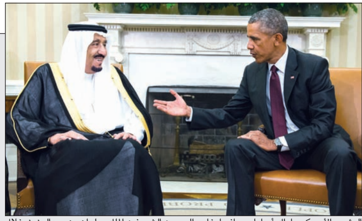
الرئيس الأميركي باراك أوباما مصافحاً خادم الحرمين الشريفين الملك سلمان بن عبدالعزيز خلال تقيمتها الثلاثاء في البيت الأبيض أمس

خادم الحرمين خلال لقائه أوباما في واشنطن: سنتعاون معاً من أجل استقرار الشرق الأوسط