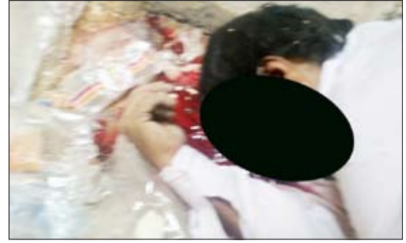
المجني عليه كان بالزي الوطني وفي العقد الرابع على أكثر تقدير