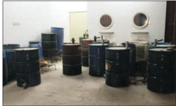
إجمالي البراميل التي ضبطت في المصنع بلغت 83 برميلا