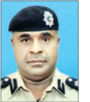
العميد عبدالله سفاح الملا