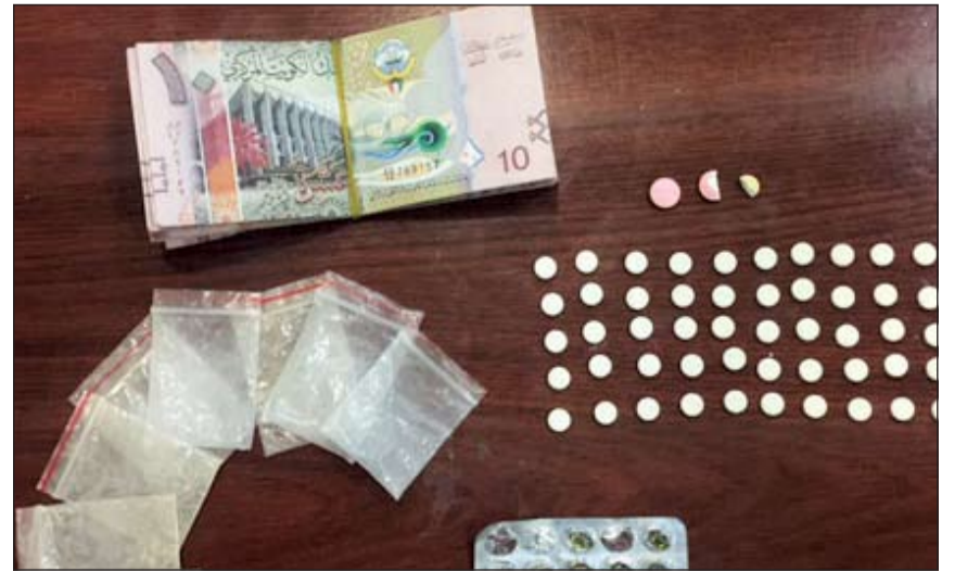
المضبوطات أحيلت إلى «الكافحة»