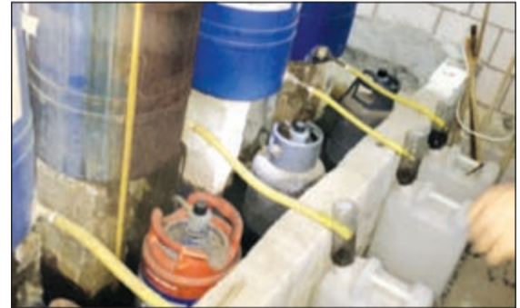
ادوات التقطير التي تم ضبطها داخل الوكر