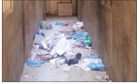
الجثة تدير في منور البناية

وكذلك رصد ما يشير من خلال المعاينة انه القى به من علو. وبحسب مصدر امني فإن بلاغا ورد الى عمليات وزارة الداخلية في ساعة متقدمة من يوم امس بوجود جثة لشخص ملقى في منور بناية في الجليب، وعلى الفور توجه الى موقع