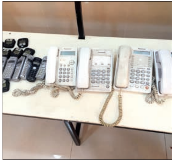
المضبوطات في وكر الاتصالات

بداخلها ثلاثة أشخاص، وتبين ان قائد المركبة مواطن مطلوب وبرفقته وأفدين من الجنسية المصرية. وبتفتيش المواطن قبل صعوده الدورية عثر بالمركبة على المواد المخدرة. من جانب آخر، أحال رجال امن الفروانية ثلاثة مواطنين ادهم مطلوب للإدارة العامة