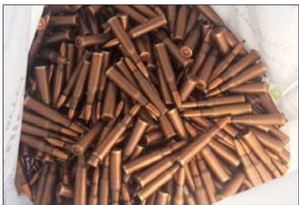
الذخيرة التي القاهما مجهولون بجوار صالة أفراح

انتقل فريق من إدارة مباحث السلاح لرفع صندوق ذخيرة أبلغ عن وجوده الى جوار صالة أفراح في منطقة الأندلس. وقال مصدر امني ان حملة وزارة الداخلية على الأسلحة مستمرة مضيفا أن إحالة كل من يضبط وهو ما دفع بحوزته أسلحة الى النيابة دفع حائزي الأسلحة والذخائر الى التخلص منها خوفا من المساءلة القانونية.