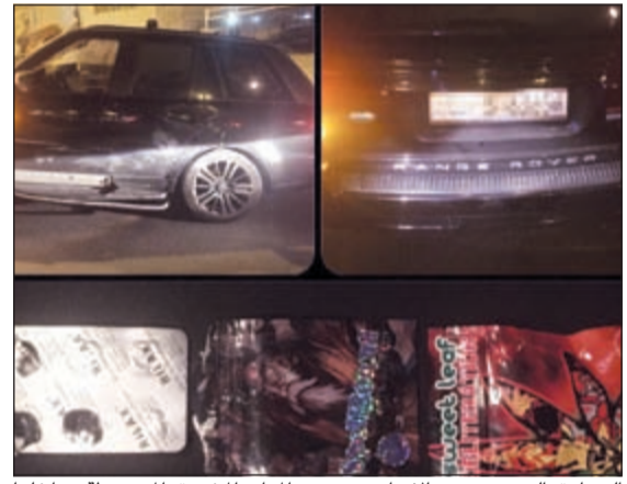
السيارة التي دهست الإيراني وتبدو المواد المخدرة المضبوطة بداخلها وبحوزة المدهوس