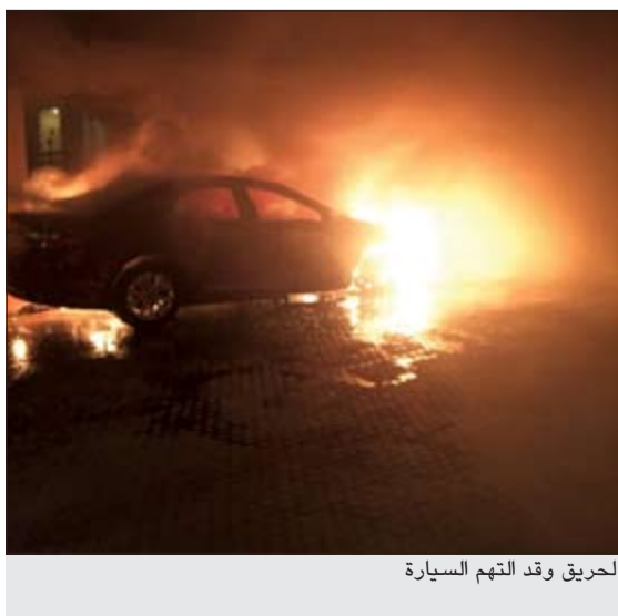
الحريق وقد التهم السيارة

فتحت الإدارة العامة للإطفاء تحقيقا لمعرفة ملايسات احتراق مركبة في منطقة الزهراء، وكانت غرفة العمليات تلقت مساء امس بلاغا بنشوب حريق مركبة في منطقة الزهراء وتوجه على اثره مركز إطفاء صباحا الى الموقع وتم التعامل مع الحريق.