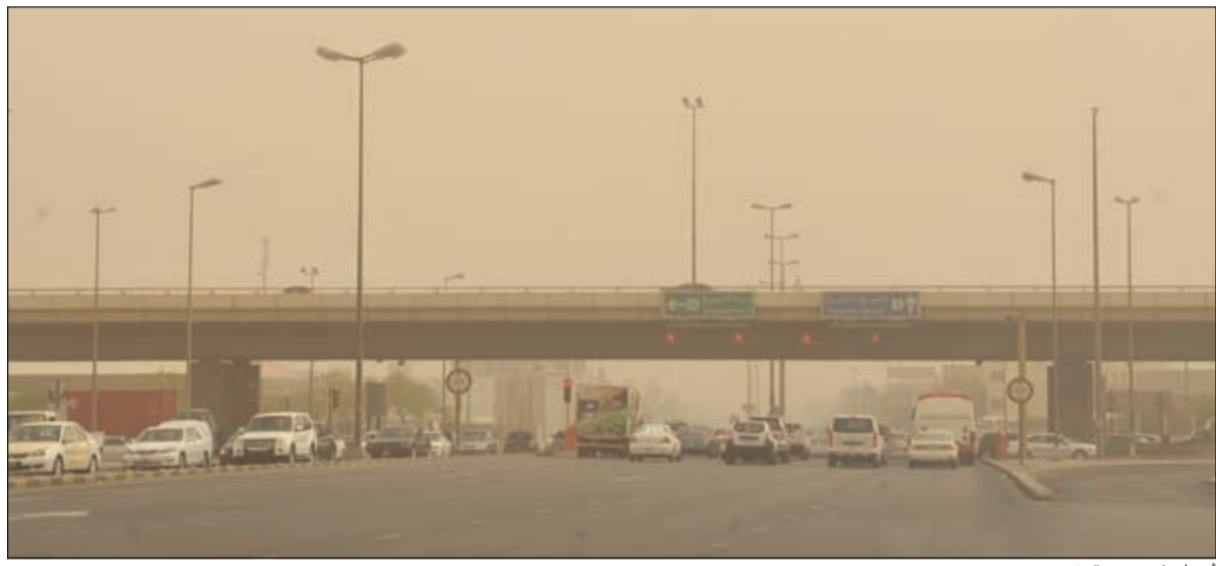
أجواء غير مستقرة

وأضاف أن طقس اليوم سيمتيز برياح شمالية غربية خفيفة إلى معتدلة السرعة تنشيط على فترات ومثيرة للغبار خاصة على المناطق المكشوفة تتراوح سرعتها بين 15 و 40 كيلومتراً في الساعة ويكون البحر خفيفاً إلى معتدل