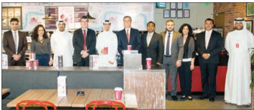
إدارة بنك الخليج و«كوستا كوفي» و«ماستركاردر» خلال حفل التوقيع