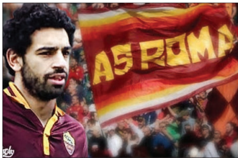
محمد صلاح مع روما