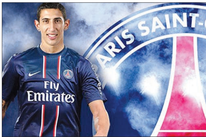
دي ماريا مع سان جرمان