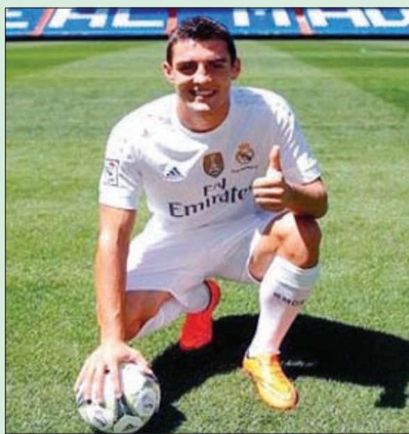
كوفانيتش مع ريال مدريد

من جانبه، عزز روما الوصيف في الموسم السابقين هجومه باليوسني ادين دزيكو من مان سيتي والمصري محمد الكولمبي جاكسون مارتينيز