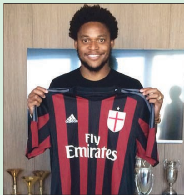
أدريانو مع ميلان

إسبانيا على غير العادة، حدث الغريمان برشلونة البطل وريال مدريد الوصيف اضطراباً كبيراً في السوق الصيفية، خصوصاً على صعيد الرحيل، لاسيما ايفونتي الفريزين، فذهب تشافي هرنانديز - قائد الفريق الكاتالوني - إلى السد القطري والحارس إيكر كاسياس - قائد الفريق الملكي - إلى بورتو البرتغالي. وبقي «البارسا» تحت الحظر المفروض عليه من قبل الاتحاد الأوروبي بسبب خروقاته لقانون اللعب المالي النظيف حتى مطلع العام 2016.