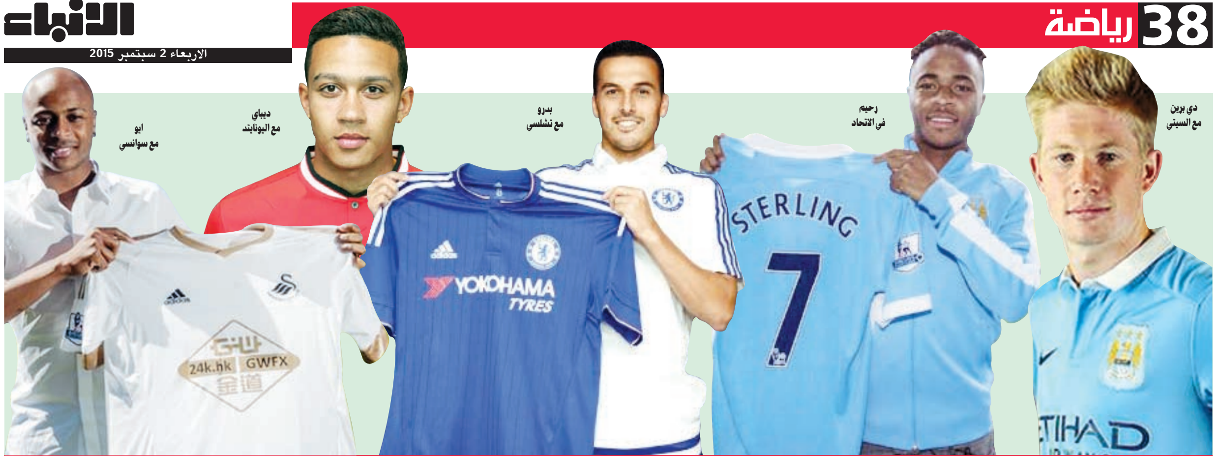
نشاط ملحوظ في «الكاتشيو».. وغياب الإثارة في «الليغا»