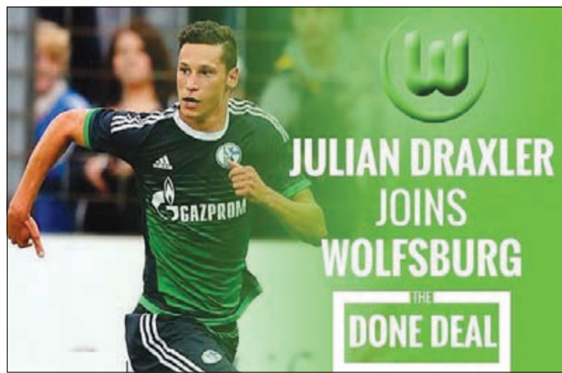
دراكسلر مع فولفسبورغ