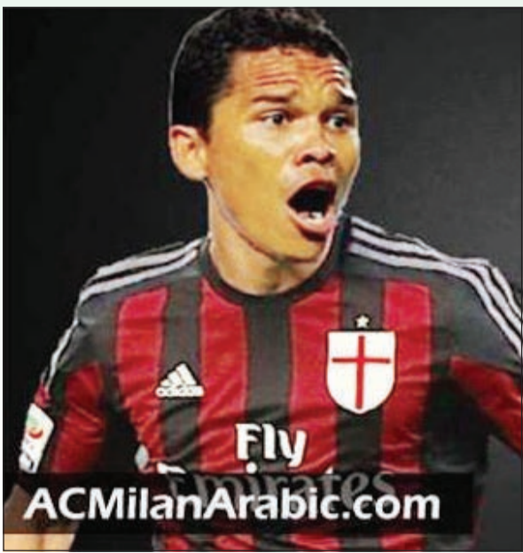
باكا مع ميلان

ودفع «السيتيزينز» مبلغ 113 مليون يورو لشراء 5 لاعبين آخرين منها 60 مليون يورو للحصول على خدمات المهاجم الدولي الإنجليزي الشاب رحيم ستريلينغ بعد ان كسب اختبار القوة في مواجهة ناديه السابق «الليفز». وذهبت سعفة هدف السابق لجاره مان يونايتد الذي عمل غربة كبيرة جدا في انتقالات هذا العام. وتخلي فريق «الشايطين» عن البرتغالي لويس ناني لمصلحة سبورتنغ لشبونة والهولندي روبن فان بيرسي إلى فريغشنة التركي فضلاً عن بيع كلا من خافيير هيرنانديز إلى ليفرپول الألماني ورافاييل البرازيلي إلى ليون الفرنسي