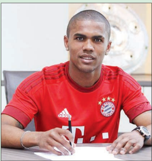
كوستا مع بايرن

من جانبه، فتح موناكو باب الرحيل أمام كوندو غيبا (انتر ميلان) والتونسي أيمن عبدالنور (فالنسيا الإسباني) وكاراسكو (اتلتيكو مدريد) والأرجنتيني لوكاس أوكامبوس التي جاره مرسيليا بعد اعارة لسته أشهر.