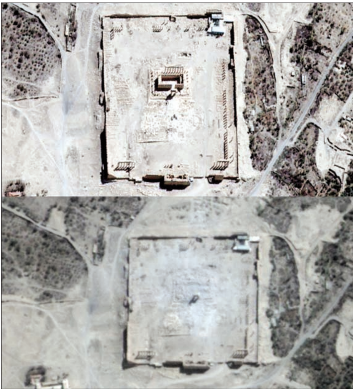
صورة الأقمار الصناعية قبل وبعد تدمير معبد بل الأثري في تدمر (أ.ف.ب)

وأشار المصدر في تصريح لوكالة الأنباء الألمانية إلى أن «قوات البشمركة تمكنت في الوقت نفسه من الرد السريع بقصف عشرات القذائف على حشودهم في قضاء تلكيف وقتل العشرات منهم وإحراق عجلتين تابعيتين لهم بالقرب من مشارف بلدة تللسقف». إلى ذلك، صرح مصدر أمني بحفاظة صلاح الدين بأن عشرات المسلحين تمكنوا من خطف 42 معتقلا كان يتم نقلهم إلى بغداد. وأوضح أن «أكثر من 50 مسلحا يرتدون لباساً أسود ويستقلون 20 سيارة دفع رباعي ويحملون مختلف أنواع الأسلحة ألقوا طريق بغداد -الديجل وحطوفوا 42 معتقلا، كان يجري نقلهم إلى بغداد»، مشيراً إلى أنهم كانوا محتجزين «وفق المادة 4 إرهاب في مقر