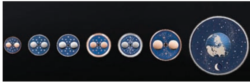
الأقراص القمرية في عدة موديلات من ساعات لانغيه والمصنوعة من الذهب الصلب الأبيض والوردي

وساعة Grand Complication في الساعة الأكثر تعقيداً من ابداع «إيه. لانغيه أند صونه»، عرض أطوار القمر هو واحد من العديد من الروائع التقنية، تتضمن الساعة آلية اعلان الوقت بال دقائق مع قاعات صغيرة وكبيرة وآلية معيد الدقائق التي تصدر صوتاً مذكراً بالدقائق وكرونوغراف الفواشي الجزئية مع عداد الدقائق والفواشي الطائفة إضافة إلى التقويم الدائم.