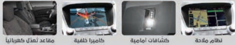
مقاعد تفعل كهربائياً