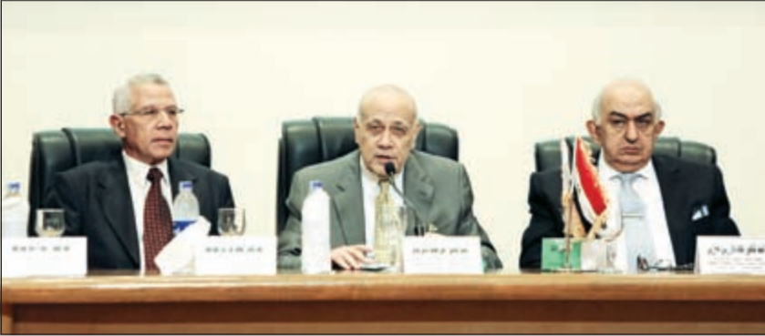
جانب من المؤتمر الصحفي

أعلنت اللجنة العليا للانتخابات فتح باب الترشح لانتخابات مجلس النواب، اعتبارا من اليوم الثلاثاء لمدة 12 يوما، على أن تجري الانتخابات على مرحلتين تبدأ في 17 أكتوبر وتنتهي في 2 ديسمبر من العام الجاري، مؤكدة أن من سبق لهم تقديم أوراق ترشحهم لن يقدموا أي أوراق جديدة غير استمارة الترشح.