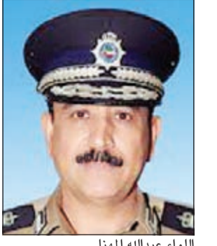
اللواء عبدالله المهنا

في إطار الجهود المبذولة لضبط الحالة المرورية في جميع المناطق، قامت الإدارة العامة للمرور بإشراف اللواء عبدالله المهنا بسلسلة من الحملات المفاجئة في المحافظات الست، وذلك خلال الفترة من 23 - 29 أغسطس، حيث أسفرت تلك الحملات عن تحرير 48148 مخالفة وحجز عدد 431 مركبة مطلوبة، كما تم إدخال عدد 27 شخصاً إلى