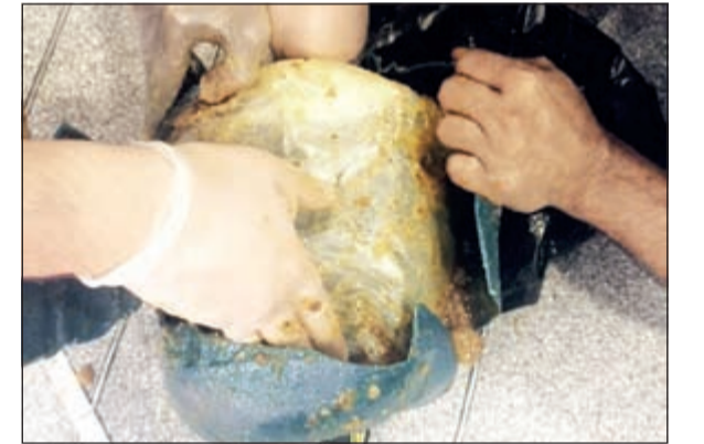
القات المضبوط بالمطار خلال استخراجه من العسل