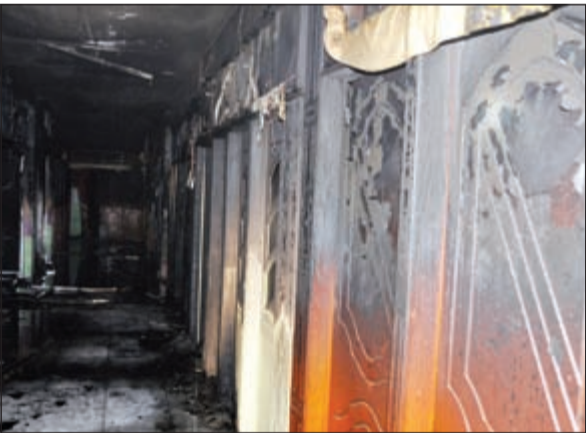
جانب من آثار حريق الفروانية