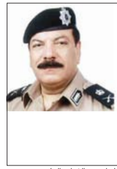
اللواء عبدالفتاح العلي