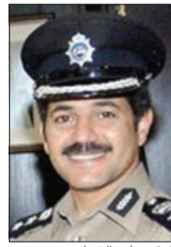
العقيد وليد الشهاب