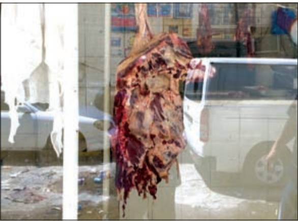
لحوم تالفة تباع في الجليب

أغلق رجال أمن الفروانية بقيادة العميد عبدالله العجمي نحو 35 محلاً وتم ضبط 20 شخصاً مخالفاً في منطقتي الجليب والحساوي وتمت إحالة المضبوطات إلى جهة الاختصاص. وقال مصدر امني ان رجال أمن الفروانية بالتنسيق مع البلدية قاموا بحملة تحت إشراف العميد عبدالله العجمي وتم إغلاق المحلات التي لا يملك القائمون عليها أي ترخيص، حيث يقومون ببيع المواد الفاسدة من أسماك وخضراوات وعلب وأدوات.