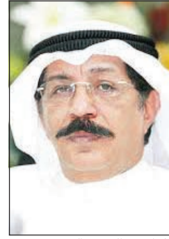
اللواء عبدالحميد العوضي

العاصمة عن أن سيدة متهمه في قضايا نصب استطاعت الخروج من البلاد والدخول إليها رغم وجود قضايا منع سفر متعددة بحقها، لكونها متهمه بالنصب على مواطنين وبمبالغ مالية فاقت المليون دينار. وأضاف المصدر: استعدت السيدة وتبين أنها غادرت وقدمت 8 مرات رغم وجود منع سفر عليها وبالتحقيق معها اعترفت بأنها تتمكن من المغادرة مقابل 8 آلاف دينار للمرة الواحدة مغادرة وعودة، وان من يسهل لها المهمة ووافد عربي يعمل محاميا