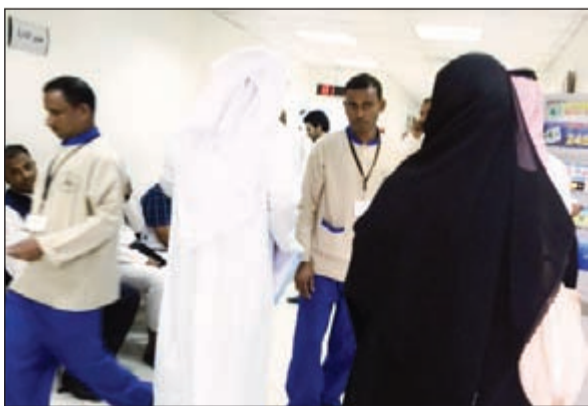
جانب من المواطنين في أحد مراكز خدمة المواطن

عمل القروانية بالإضافة إلى برج التحرير في استقبال المراجعين على فترتين صباحية ومسائية. وتمتعي الشعلائي على المراجعين إن يتقدموا إلى مراكز خدمة المواطن لإنجاز معاملاتهم وجميع الإجراءات متوافرة كل حسب عنوان المنشأة ولا داعي لمراجعة الإدارة المركزية وذلك تسهيلاً على المراجعين من المواطنين. وبين أن هناك 4242 مواطناً مسجلين للعمل في