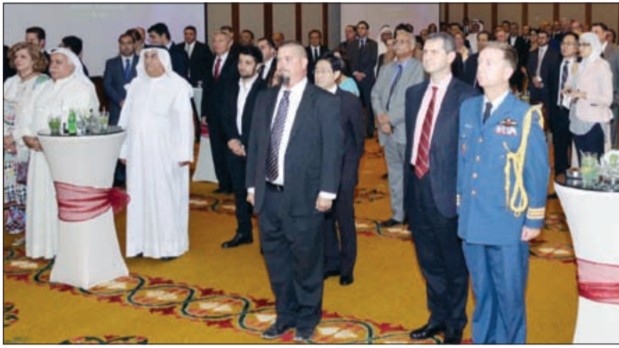
جانب من الحضور

كانتا قريبتين لقلوبهم كونها وطنهم الأم». وبين السفير التركي أنهم حالياً يواجهون مرة أخرى تحديات تستهدف وحدتنا وتماسكنا وأختنا ومستقبل دولتنا وأمتنا، مشيراً إلى أنهم عاشوا على هذه الأرض منذ آلاف السنوات استطاعوا عبرها هزيمة الكثير من الأعداء والطامعين. وأكد أنهم سينتصرون على تهديدات الإرهابيين بوحدتهم وتماسكهم كجسد واحد وروح واحدة تجاه جميع الأعداء في الداخل والخارج.