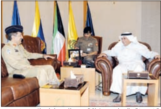
الشيخ خالد الجراح مستقبلاً العميد طاهر جزار ملك

استقبل نائب رئيس مجلس الوزراء ووزير الدفاع الشيخ خالد الجراح الملحق العسكري الباكستاني المقيم في الرياض بالملكة العربية السعودية الشقيقة العميد طاهر جزار ملك، بمناسبة انتهاء فترة مهام عمله في البلاد. حيث وجه الجراح شكره وتقديره للعميد طاهر على ما قام به من جهد أثناء فترة عمله في البلاد متمنياً له دوام التوفيق والنجاح.