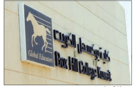
مبنى كلية «بوكسهل»

هنأت إدارة القبول والتسجيل في كلية بوكسهل الكويت الطالبات اللواتي تم قبولهن في خطة البعثات الداخلية للفصل الدراسي الأول 2015/2016. ودعتهن لمراجعة الكلية لاستكمال طلبات التسجيل.