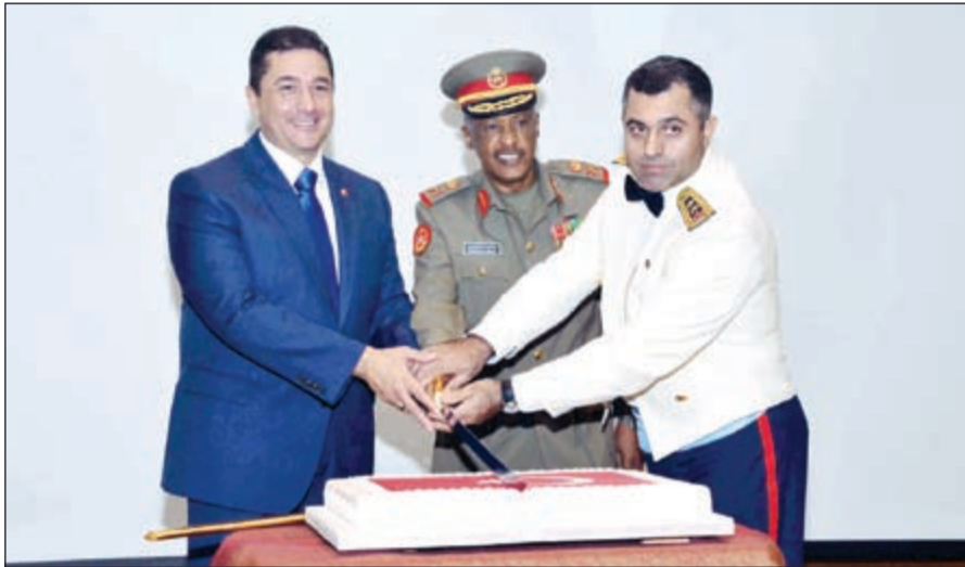
معاون رئيس الأركان لهيئة القوى والإدارة البشرية اللواء إبراهيم العميري يشارك السفير التركي مراد تامير والملحق العسكري التركي قطع كيك الاحتفال

من جانبه، هذا السفير التركي مراد تامير «جميع المواطنين الأتراك الذين يعيشون في 81 مقاطعة في تركيا وكل زاوية في العالم بمناسبة يوم