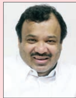
المخرج سعد بورشيد