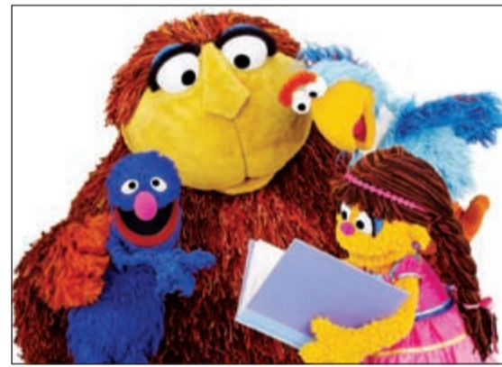
شخصيات «افتح يا سمسم»

وأضاف علي الرئيس أن المؤسسة قامت بإنتاج سلسلة من الأفلام الوثائقية حول المدن الخليجية بواقع سبعة أفلام وثائقية بالتعاون مع المنظمة الدولية للهجرة حول مكافحة الاتجار بالبشر، وتصميم الحملات الإعلامية التوعوية للعديد من المنظمات والهيئات والمؤسسات وترسيخ الأمن المجتمعي، والترويج لنهج الوسطية في وجه التطرف والإرهاب والعنف، وقيامها للمرة الثالثة بتنفيذ الحملة الإعلامية الوطنية لتشجيع الشباب على الإخراط في العمل لدى القطاع الخاص بتكليف من برنامج القوى العاملة والجهاز التنفيذي لإعادة الهيكلة، وذلك بعد نجاحها في تنفيذ أول حملتين بعنوان «التحدي».