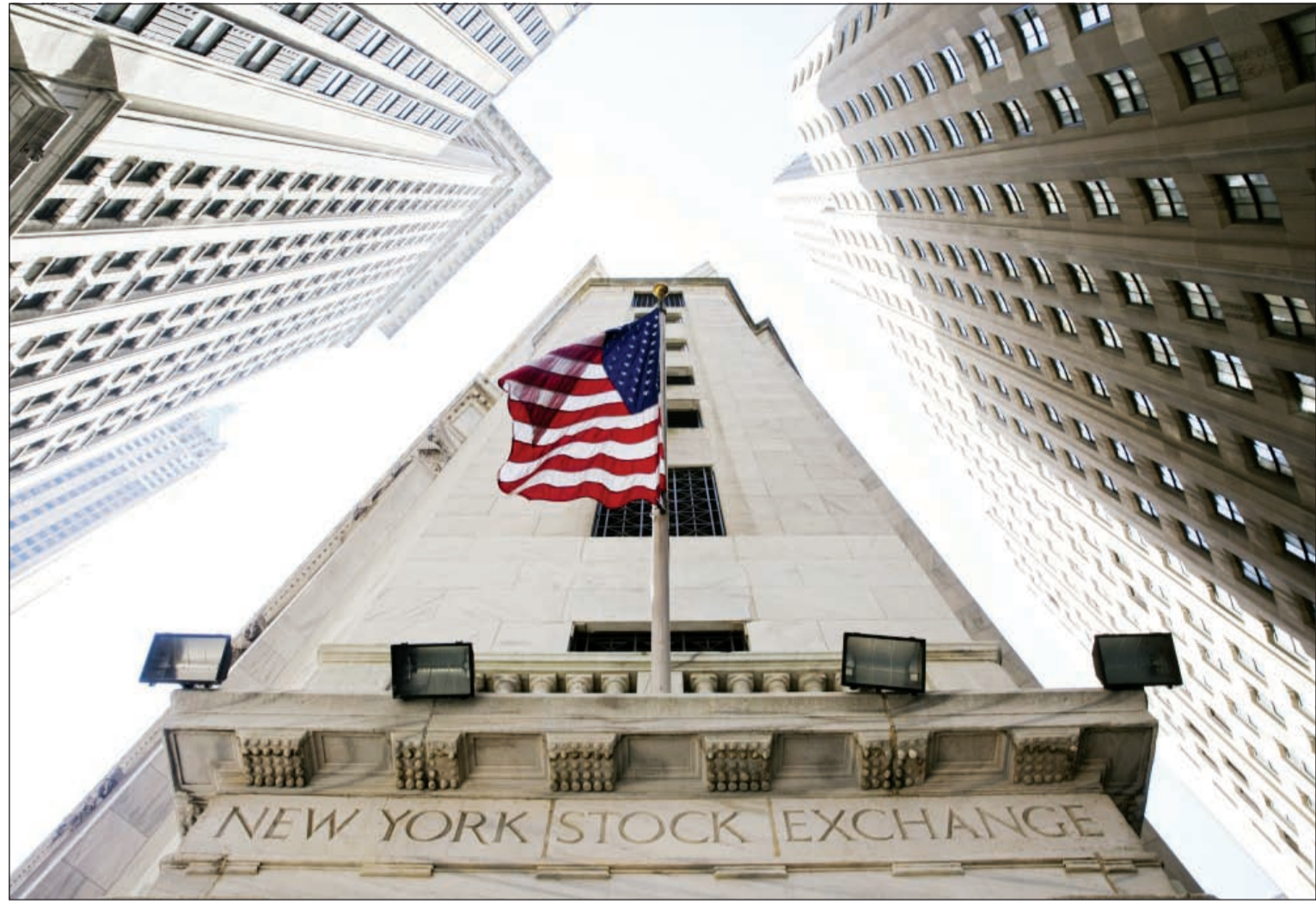
توقعات بعدم رفع الاحتياطي الفيدرالي أسعار الفائدة الشهر المقبل، وفي الصورة تظهر بورصة نيويورك والتي حققت أكبر مكسب في يوم واحد في 4 سنوات الأربعة الماضية (رويترز)

قال تقرير «الوطني» انه بعد الاضطراب الهائل الذي بدأ يوم الجمعة 21 أغسطس، خفض البنك المركزي الصيني أسعار الفائدة الإسنادية بمقدار 25 نقطة أساس ونسبة الاحتياطي المطلوبة بمقدار 50 نقطة أساس، فيما أزال في الوقت نفسه السقف على أسعار الفائدة على الودائع لأجل التي تتجاوز تواريخ استحقاقها السنة. ويحتمل أن تكون هذه التخفيضات قد جاءت نتيجة لاضطراب السوق المالي في الصين كما في الخارج، وليس نتيجة البيانات الاقتصادية الضعيفة أو خروج رؤوس الأموال. وتستمر الأسواق بتوقع المزيد من خفض أسعار الفائدة في عام 2015.