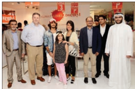
من المشاركين في الافتتاح