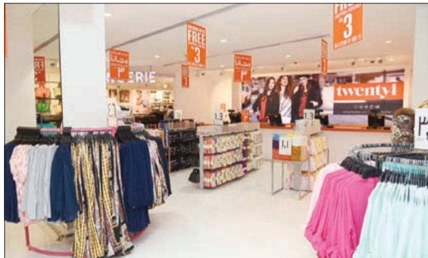
جانب من المعروضات