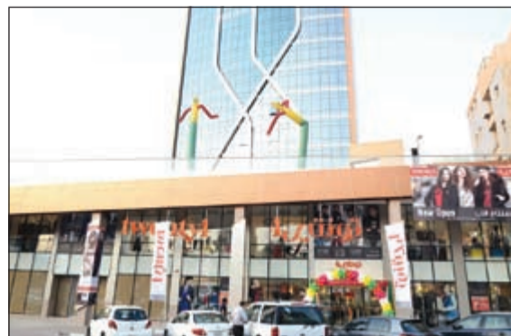
واجهة محل تونتي 4