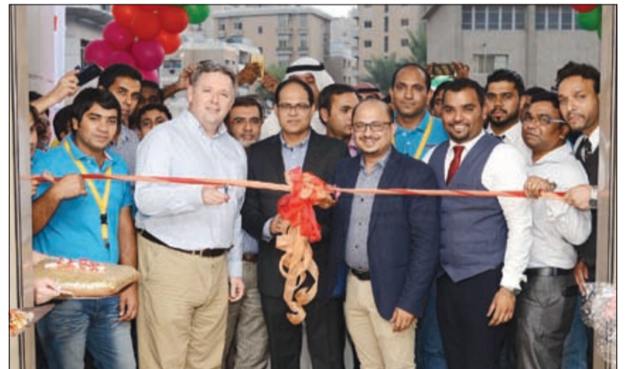
قصر شريط الافتتاح