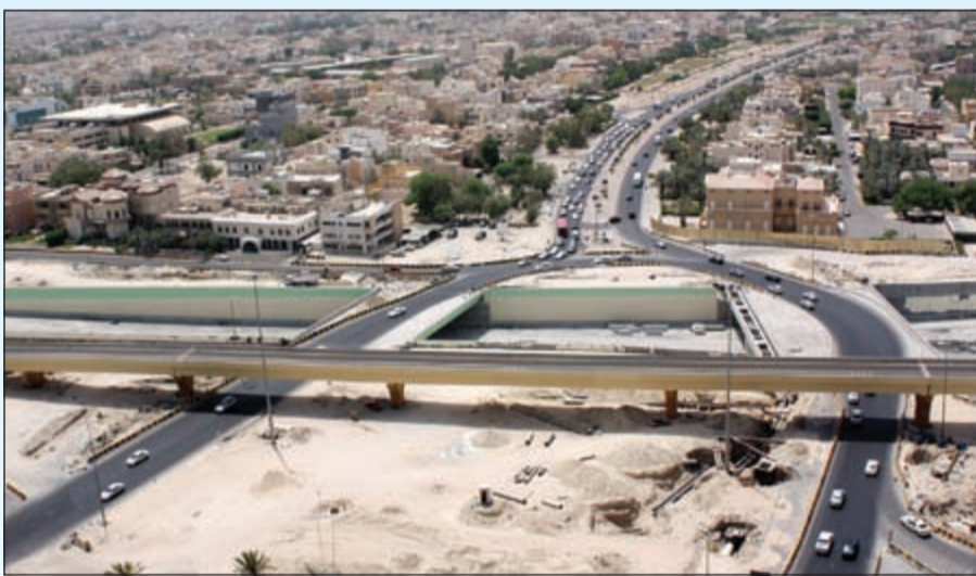
مشروع تطوير الدائري الاول

● ستكون هناك زيادة للوحات الاعلانية في الشوارع والطرق بالإضافة الى العلامات الإرشادية الدالة على المواقع والمدن.