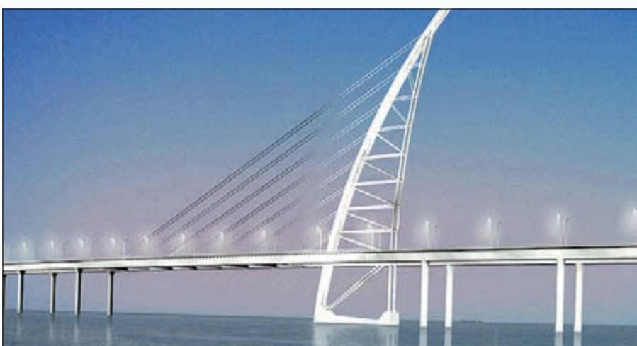
مخطط مشروع جسر جابر