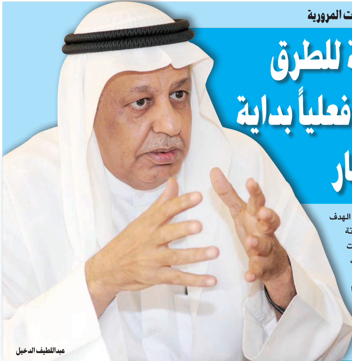
عبد اللطيف الدخيل

رئيس «الهيئة» أكد أنها تهدف إلى رفع كفاءة الطرق وخدمات النقل للقضاء على الاختناقات المرورية