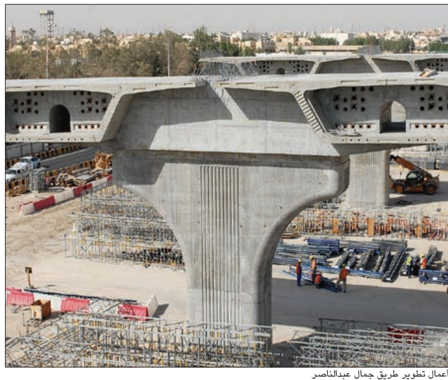
أعمال تطوير طريق جمال عبدالناصر