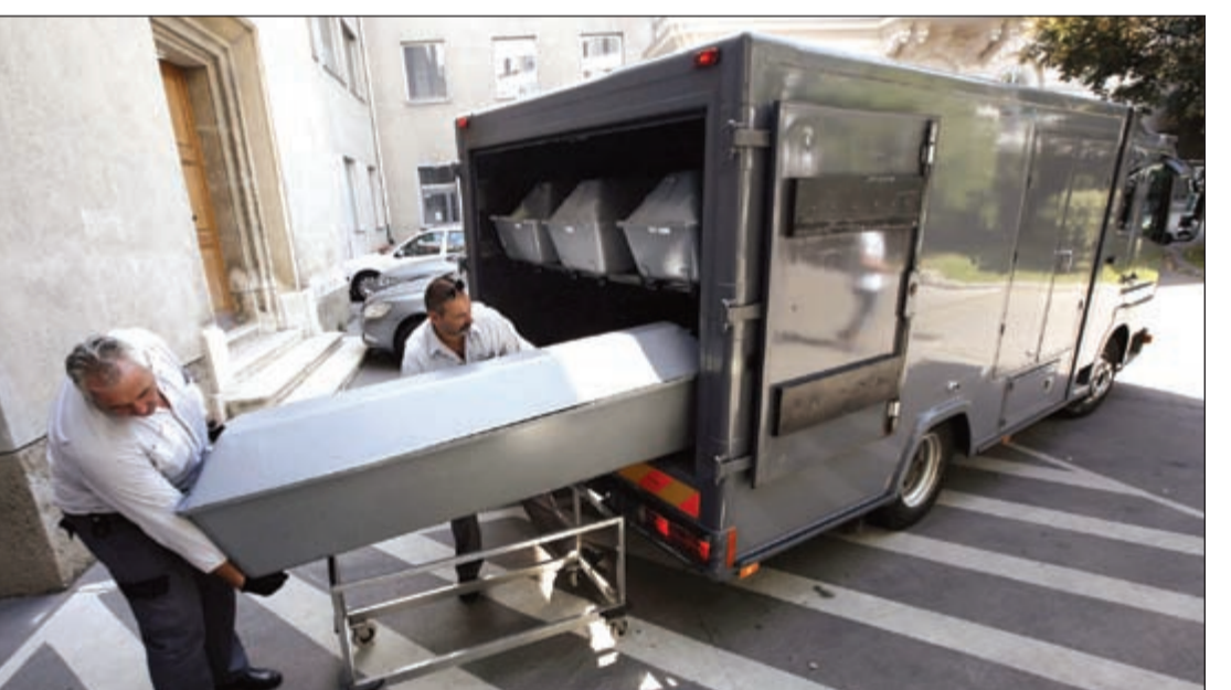
نقل جثث السوريين ضحايا الشاحنة المتروكة في النمسا إلى الشرطة الجنائية للتحقيق أمس

عواصم - أ.ف.ب: أعلنت الشرطة النمساوية أمس ارتفاع عدد ضحايا الشاحنة التي عثر عليها أمس الأول على حافة الطريق شرق النمسا، فيما لقي نحو 200 مهاجر من أفريقيا والشرق الأوسط غرقاً قربهم المكثف قبالة ساحل ليبيا. وأكدت الشرطة أنها انتشلت نحو 71 جثثاً من السوريين وهم 59 رجلاً و8 نساء و4 أطفال بينهم طفلة في سنتها الأولى أو الثانية و3 أطفال في الثامنة والتاسعة والعاشر. وكشفت الشرطة النمساوية أنه تم القبض على 3 أشخاص في المجر لصلتهم بالحادث بينهم بلغاري من أصل لبناني. وقال متحدث باسم الشرطة للصحافيين أن السلطات عثرت على «وثيقة سفر سورية» في الشاحنة وسط الجثث المنحللة، مضيفاً أنه يعتقد أن الاعتقالات ستقود إلى الأشخاص الذين كانوا وراء موت المهاجرين. وأضاف أن المجموعة تتألف «على الأرجح» من لاجئين سوريين. و«بما كنا ان نستبعد احتمال أن يكونوا أفارقة».