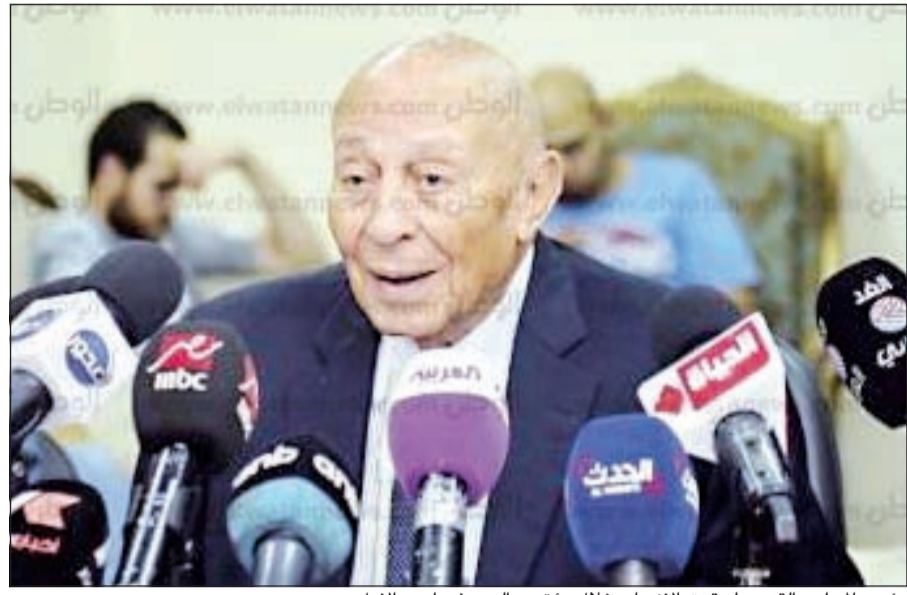
رئيس المجلس القومي لحقوق الإنسان خلال مؤتمره الصحفي أمس الأول