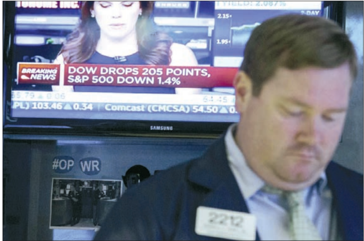
صورة لرجال المستثمرين في الإثنين الأسود هذا الأسبوع وتظهر الشاشة في الخلف حجم الهبوط في الأسواق الأميركية

خسر اغني 400 شخص حول العالم، بينهم أثرياء عرب من دول الخليج، نحو 306 مليارات دولار في غضون 8 أيام فقط في الأسواق العالمية نتيجة انهيار البورصات الآسيوية، منها نحو 182 مليار دولار من مجموع ثرواتهم خلال الأسبوع الماضي فقط بعد التراجع الحاد في الأسواق العالمية، و124 مليارات يوم «الاثنين الأسود» 24 أغسطس، بحسب مؤشر بلومبرج الاقتصادي.