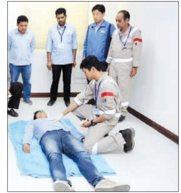
جانب من التدريب

حالات الطوارئ والإسعافات الأولية، كما يستهدف خلق الوعي لدى المنتسبين في كيفية التعامل مع الحالات الطبية الطارئة، ومساعدة المصاب بالطرق اللازمة، وللتقليل من خطر المضاعفات، مشيرة إلى أن ما يقرب من 4 ملايين شخص، يعانون من الإصابات والأمراض التي تحدث في مكان العمل وفقا لإدارة السلامة والصحة المهنية.