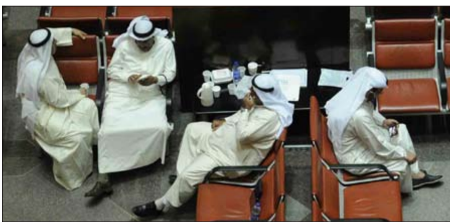
مخالفات بالجملة في تداولات الأسهم ترصدتها هيئة أسواق المال في تقريرها الجديد لسنة 2015 (هاني عبد الله)

مجلس التأديب نظر في 78 حالة مخالفة.. حفظ منها 29