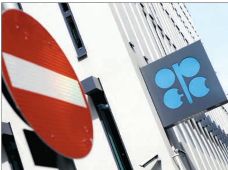
شعار منظمة أوبك في فيينا حيث يتوقع مندوبو دول الخليج ارتفاعاً قوياً لسعر برميل النفط ليتراوح بين 50 و55 دولاراً حتى نهاية السنة

لندن - رويترز: استقرت أسعار النفط أمس بعدما تعافت من أدنى مستوياتها في ست سنوات ونصف السنة بفعل انتعاش أسواق الأسهم ونمو قسوي للاقتصاد الأمريكي وأنباء عن تراجع إمدادات الخام من نيجيريا. وسجل النفط أكبر مكاسبه اليومية منذ عام 2009 الخميس إذ صعد مزيج برنت والخام الأمريكي الخفيف أكثر من 10٪. ويتجه الخام الأمريكي إلى تحقيق أول مكاسبه الأسبوعية في تسعة أسابيع ليهي أطول موجة خسائر من نوعها منذ عام 1986. وانخفض سعر مزيج برنت 15 سنتاً إلى 47,41 دولاراً للبرميل. واستقر الخام الأمريكي دون تغيير عند 42,56 دولاراً للبرميل. ومحليا ارتفع سعر برميل النفط الكويتي 1,6 دولار ليبلغ 42 دولاراً. وقالت صحيفة وول ستريت جورنال: إن فنزويلا تجري اتصالات مع دول أخرى أعضاء في منظمة البلدان المصدرة للبترول (أوبك) وتطالب بعقد اجتماع طارئ مع روسيا لإعداد خطة لدعم أسعار النفط. وقال مسؤولون في دول خليجية أعضاء بالمنظمة: إنه لا توجد فرصة تذكر لأن تعقد المنظمة اجتماعاً دون دعم السعودية التي قالت من قبل إنها لا ترى ضرورة لعقد هذا الاجتماع. وتوقع مندوبان خليجيان لدى «أوبك» تراوح سعر النفط بين 40 و50 دولاراً للبرميل حتى نهاية العام، وبيانات في وصوله إلى 60 دولاراً. وقال مندوب خليجي ثالث: إن أسعار النفط قد تنزل مجدداً لأقل قليلاً من 45 دولاراً قبل أن تتعافى لنحو 60 دولاراً بحلول ديسمبر. وقال مندوب رابع لدى «أوبك»: 50 - 55 دولاراً هو أقصى ما أتوقعه لسعر برميل النفط حتى نهاية العام 2015.