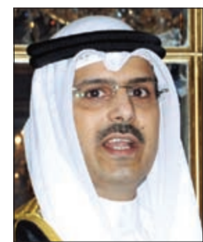
السفير ناصر المطيري

واضحة بهذا الشأن. وكشف السفير الكويتي عن أن السلطات البوسنية المختصة بصدد دراسة تعديل بعض التشريعات التي ستساهم في جذب المستثمرين الخليجيين وخاصة من الكويت. وأشار في هذا السياق إلى زيارات قريبة لمسؤولين بوسنيين إلى الكويت لبحث سبل تعزيز العلاقات بين البلدين في مجالات سياسية واقتصادية من أهمها زيارة لوزير الخارجية يغور تسرناداك في نوفمبر المقبل.