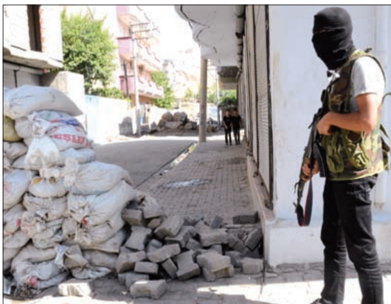
مسلك كردي يقطع الطريق بحاجز نصبه المتطرفون في قرية سيزري في ولاية شيرناق جنوب شرق تركيا

أنقرة - وكالات: أُنجز رئيس الوزراء التركي احمد داود أوغلو تشكيلته الحكومية الانتقالية التي يفترض أن تقود البلاد حتى الانتخابات المبكرة التي ستجري في مطلع نوفمبر المقبل قبل عرضها على الرئيس رجب طيب أردوغان أمس. وخلافاً للاشتركيين الديموقراطيين، وهم ثاني قوة في البرلمان وحزب «الحركة القومية»، فقد وافق حزب «الشعوب الديموقراطي» المؤيد للمتطرفين الأكراد على الانضمام إليها. وستكون هذه المرة الأولى في تاريخ تركيا التي يشارك فيها نواب حزب مؤيد للأكراد في حكومة.