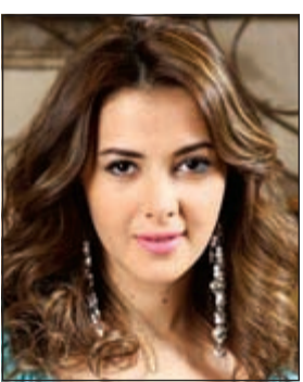
دنيا سمير غانم

الخاصة بالألبوم. وانتهت سميحة من تصوير بوسترات ألبومها بأكثر من «لوك» مختلف وسيتم طرحها خلال الفترة القليلة المقبلة. وتتعاون سميحة في ألبومها الجديد مع عدد كبير من كبار الشعراء والملحنين البارزين. ويحتوي الألبوم على أغاني جمال وعزيز الشافعي ومن