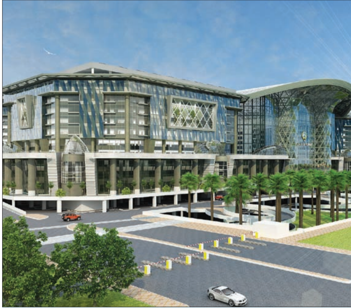
إعادة طرح مشروع مجمع الوزارات بالجهراء نهاية العام الحالي 03