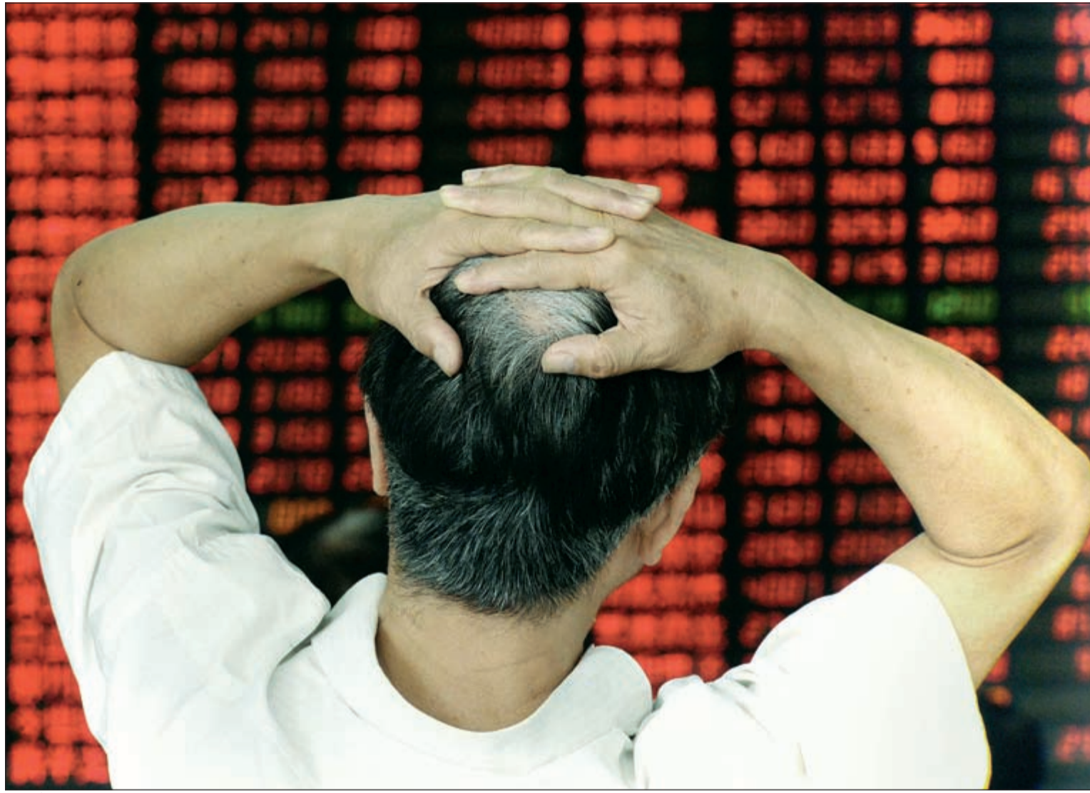
رغم خفض الفائدة مازال المستثمرون غير مقتنعين بقدرات بكين للخروج من حالة التباطؤ

هبطت أسعار الذهب أمس مع انتعاش الأسهم بعد قيام الصين بتخفيف السياسة المالية أكثر لدعم اقتصادها المتعثر وأسواق الأسهم التي أدت الهبوط الحاد في الأسواق العالمية هذا الأسبوع. وهبط سعر الذهب في العقود الفورية 0,4٪ إلى 1135,26 دولارا للأوقية (الأونصة) باتجاه تسجيل خسائر لليوم الثالث بعد أن هبط 1,2٪ الثلاثاء وهو أكبر هبوط منذ 20 يوليو. وتراجع سعر الذهب الأمريكي تسليم ديسمبر 0,3٪ إلى 1135,30 دولارا للأوقية.