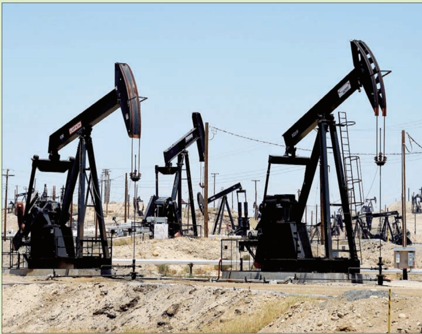
بغزة الامدادات تكبح تعافي أسعار النفط، وفي الصورة تظهر مضخات نفط تابعة لشركة شيفرون في ولاية كاليفورنيا

النفط الكويتي ينخفض إلى 40,4 دولارا للبرميل