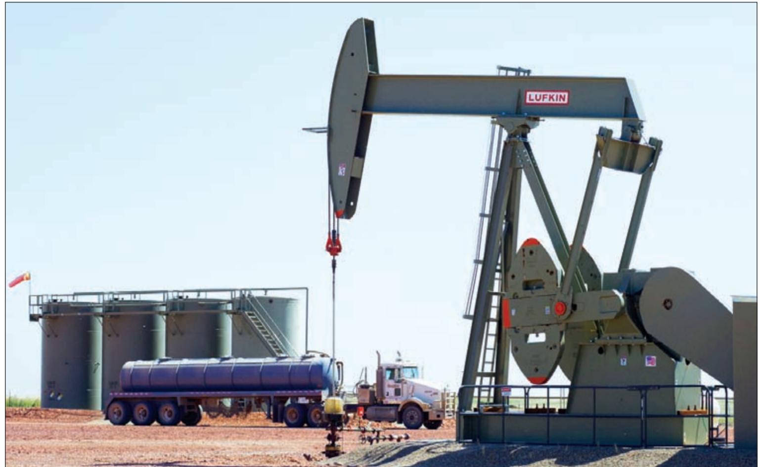
النفط يواصل الهبوط بضغط من وفرة المعروض ومخاوف المستثمرين من انكماش الاقتصاد الصيني وتظهر في الصورة منصة حفر تقع في مدينة داكوتا الشمالية بالولايات المتحدة الأميركية التي تجاهد للحفاظ على ثورة النفط الصخري

وفي حين لاحظت بوار على اتجاه الأسواق للتحقق الانفاس بعد الخسائر الحادة الأخيرة منبت الأسهم الصينية بمزيد من الخسائر ونزلت 4% نتيجة مخاوف المستثمرين من انكماش اقتصادي في ثاني أكبر اقتصاد في العالم وأكبر دولة مستهلكة للسلع الأولية. وقال فريدريك نيومان الرئيس المشارك لبحوث الاقتصادات الآسيوية في «اتش. بي.سي» في مذكره للعملاء «حتى أكثر المتعاملين خبرة وجد صعوبة في مواجهة الاضطرابات الأخيرة، وسيكون هناك المزيد على الأرجح». وقال «اقتصاد الصين يواصل التباطؤ ولا يزال احتمال رفع مجلس الاحتياطي أسعار الفائدة قبل نهاية العام قائماً ما يحدث صدعا في ركيزتين أساسيتين لنمو الاقتصاد العالمي في السنوات الأخيرة: الطلب في الصين (ويشمل السلع الأولية) والتمسير التقدي». ولا يزال الخامان قرب أدنى مستوياتهما أول من أمس عند 37,75 دولاراً للبرميل و42,23 دولاراً لبرنت وهما الأدنى منذ عام 2009، ما يشير إلى أن المخاوف بشأن الآفاق الاقتصادية في الصين تضارع في الوقت الحالي تلك الخاصة بتخمة العروض التي يشهدها السوق منذ أكثر من عام.