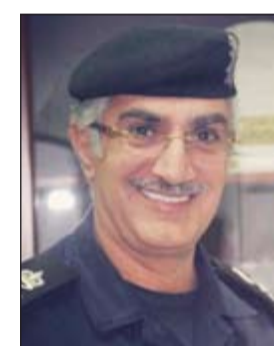
اللواء ابراهيم الطراح

عن اسباب وضعهما اعترفا بانهما تناولتا مادة الشبو، فتمت إحالتهم إلى جهة الاختصاص. وقال المصدر: ان المواطن اتضح انه مطلوب لقاء القبض عليه لمكافحة المخدرات، اما الفتاة فتبين انها مطلوبة لتغيب بالإضافة إلى انتهاء إقامة.