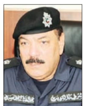
اللواء عبدالفتاح العلي

أحوال وكيل وزارة الداخلية المساعد لشؤون الأمن العام اللواء عبدالفتاح العلي مواطنا إلى «مكافحة المخدرات» بعد أن تم ضبطه في السالمية وعثر بحوزته على كف حشيش. وقال مصدر اممي: إن إحدى دوريات الأمن رصدت مركبة بصدر عنها صوت مذبذع، ولدى توقيف الشخص لتحرير مخالفة تبين انه غير طبيعي، وبتفتيشه عثر بحوزته