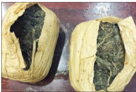
الماريغوانا المضبوطة في امتعة الوافدة