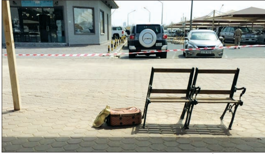
«الداخلية» اقامت سباجاً حول الشنطة لحين وصول ادارة المتفجرات