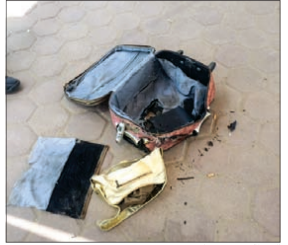
الشنطة بعد تفجيرها عن بعد