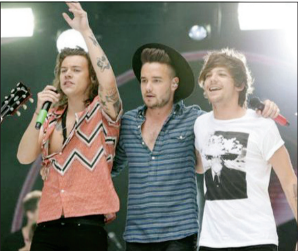
أعضاء الفريق يستعدون للافتراق

أفادت تقارير بأن أعضاء فريق «وان دايركشن» الغنائي البريطاني سيتوقفون عن العمل لفترة غير محددة العام المقبل بعد خمس سنوات من بزوغ نجمهم إثر المشاركة في برنامج «ذا إكس فكتور» لاكتشاف المواهب الفنية.