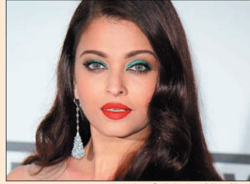
الممثلة وملكة جمال العالم آيشواريا راي

ام.بي.سي: نشرت صحف فنية أن الممثلة وملكة جمال العالم «آيشواريا راي» من المقرر أن تقوم بتقديم أغنية بصورتها في فيلمها المنتظر بقوة Jazbaa، والذي سيعرض في صالات السينما الهندية يوم 9 أكتوبر المقبل. وبحسب ما نشره موقع ApunKaChoice فإن آيشواريا البالغة من العمر 41 عاما ستغني بصوتها لتقديم إحدى أغنيات الفيلم.