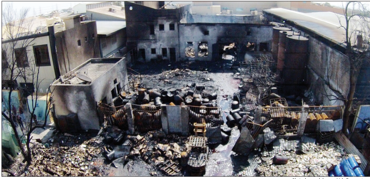
المصنع من الداخل بعد أيام من احتراقه