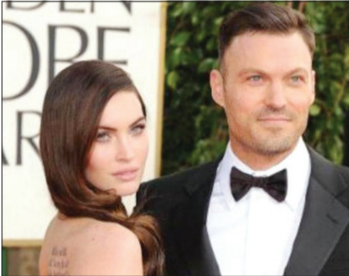
ميغان فوكس وزوجها

هذا وكانت التقارير الإعلامية قد أشارت في الأسبوع الماضي إلى أن