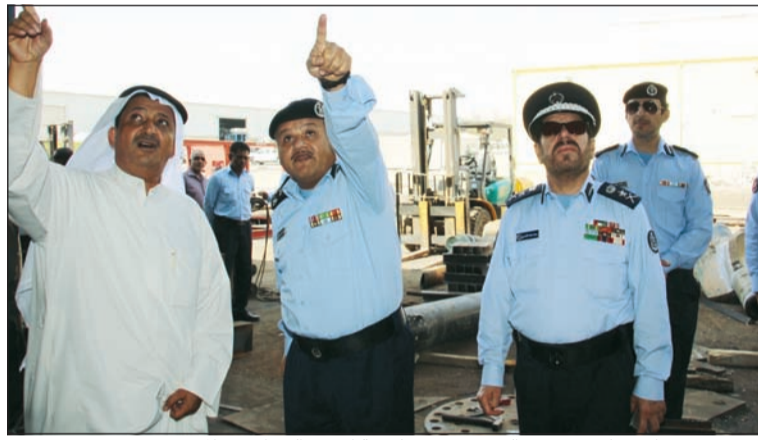
الفريق يوسف الانصاري يستمع الي شرح حول كيفية اندلاع النيران في المصنع

ومن جهة التحقيق أفاد مراقب تحقيق حوادث الحريق بالإدارة العامة للإطفاء الرائد سيد حسن الموسوي أن فرقة التحقيق باشرت عملها منذ الساعات الأولى من اندلاع الحريق، واستمرت التحقيقات على مدى يومين للوقوف على الأسباب التي أدت الي اندلاع هذا الحادث بفضل من الله سبحانه وتعالى وبحرفية رجال الإطفاء الشجعان لذلك قمنا اليوم بتفقد موقع الحادث لتقييمه والأخذ بالملاحظات التي توصلت إليها نتائج التحقيق لكي نعرض في الندوة، وأشأت العميد البليهيس الي أن الحادث موفق لدينا بالتصوير بالفيديو والفوتوغراف من