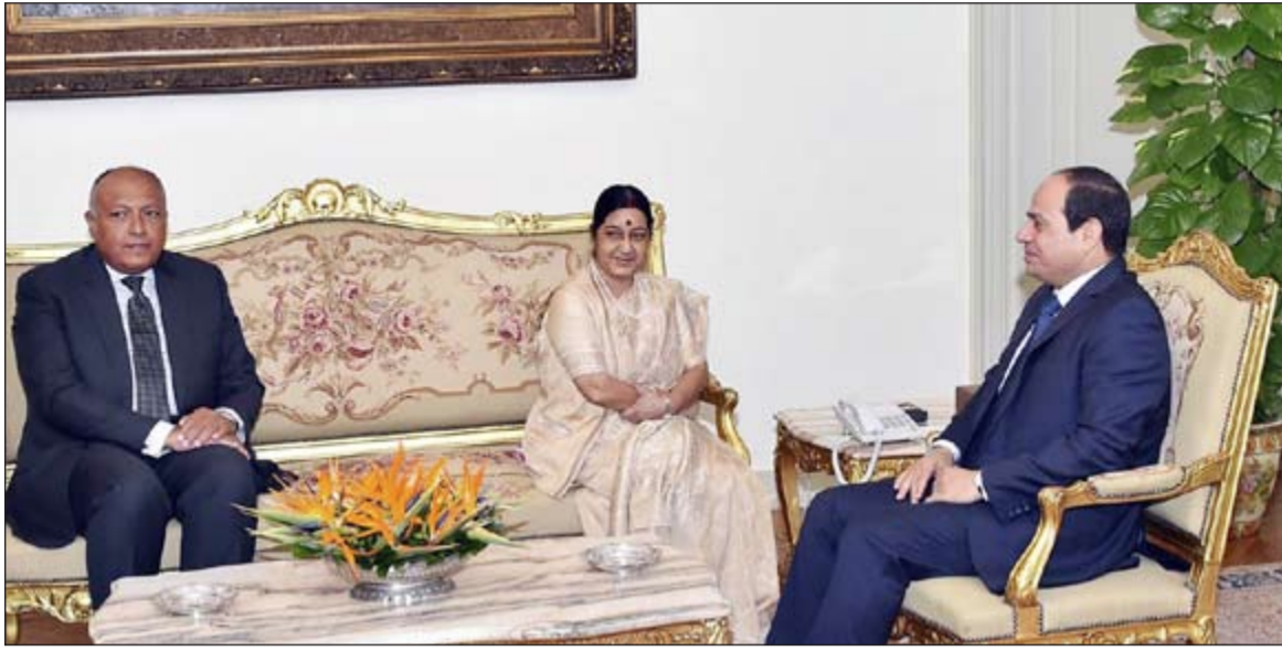
الرئيس عبد الفتاح السيسي خلال لقائه وزير الشؤون الخارجية الهندي سوشما سواريچ