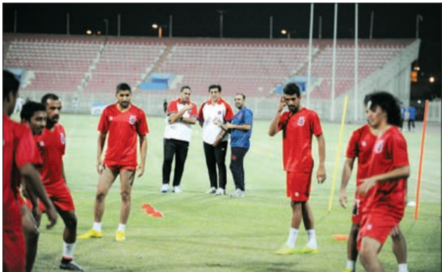
الكويت يستعد بقوة لمواجهة كيتشي