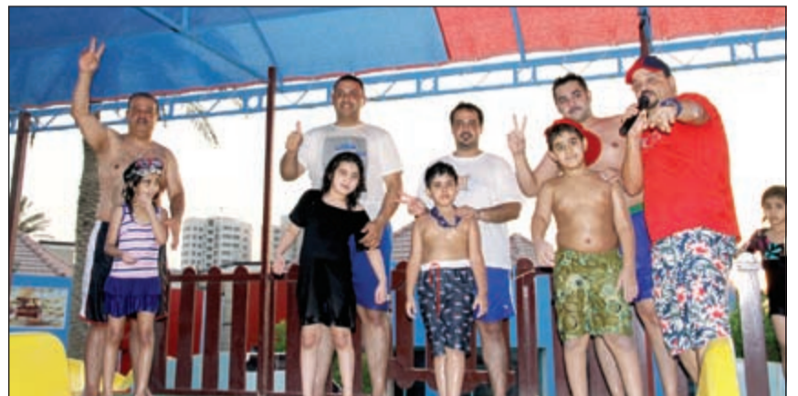
مشاركة عائلية بلجدي الفقرات