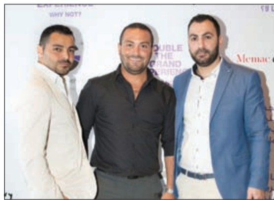
اداريو غراند سينما