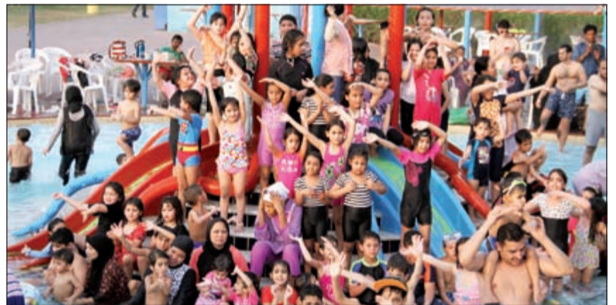
ومنتى الكويت سلمت للمجد .. بصوت واحد

الهدايا والجوائز التذكارية على الأطفال والمشاركين الفائزين، واستمتع الضيوف وعائلاتهم باجواء الاكوابارك الجميع، وتمنوا تكرار مثل هذه الدعوات.