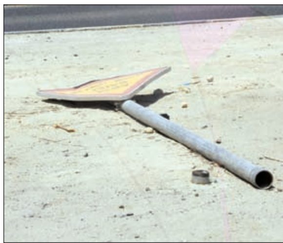
لوحة إرشادية ملقاة على الرصيف