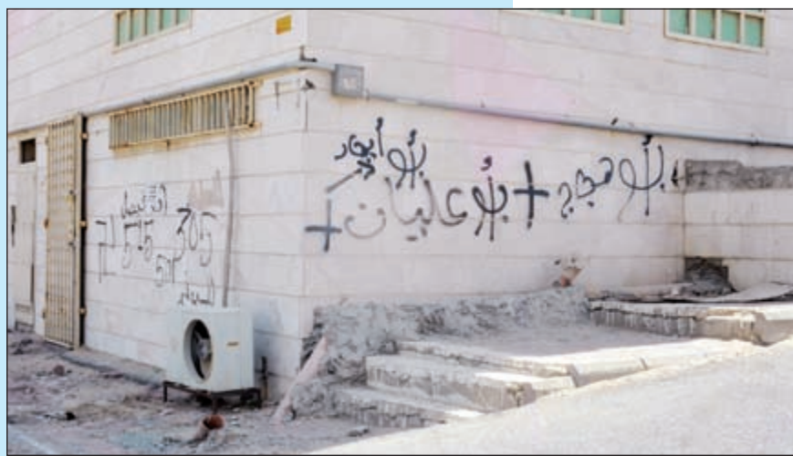
كتابات ورسومات على أحد الجدران

«الأبناء» تجولت في «صباح الناصر»، وكان الاستطلاع التالي: اجمع عدد من اهالي المنطقة على ان المشاكل فيها كثيرة جدا فهي لا تعد ولا تحصى، ولكن اذا اخترنا لبعضها لوجدنا انها تكمن في وجود جمعية واحدة والقليل من المحلات التجارية التي لا تسد حاجة المواطنين اليها، حيث المركز الصحي الوحيد الذي يغلق مبكرا، الامر الذي يجبر المواطنين على الذهاب الى مستشفى الفروانية وهو الآخر يعتبر مصيبة بحد ذاته نظرا للازدحام الكبير فيه وللعدد الكبير لسكان المناطق التي يغطيها، والذين يقصونه للعلاج والطبابة فيه، كذلك ما تعانيه المنطقة من حيث المداخل والمخارج القليلة، حيث إن المنطقة بحاجة الى استحداث مداخل جديدة، بالإضافة الى التشويش على الهواتف الناتج من السجن المركزي، حيث انه يعد من الأماكن القريبة لمنطقة