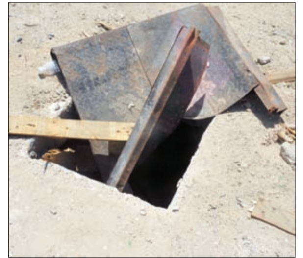
انتبه.. هنا حفرة!