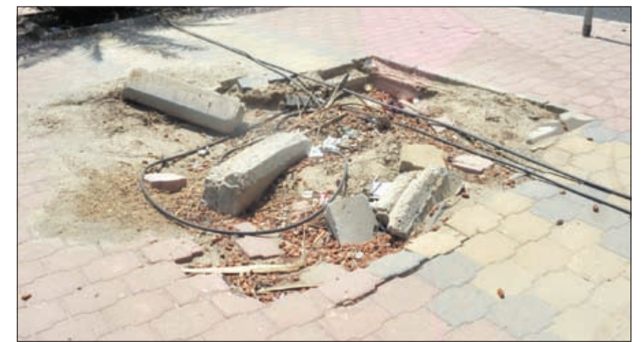
أسلاك مكشوفة فوق الرصيف