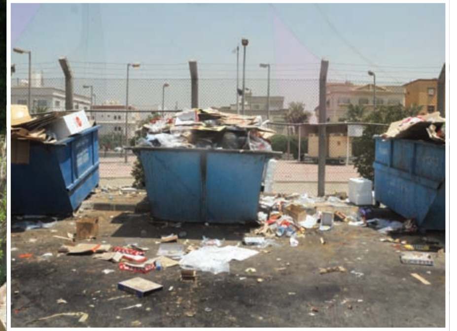
الحاويات امتلأت بالقمامة ومحيطها غير نظيف