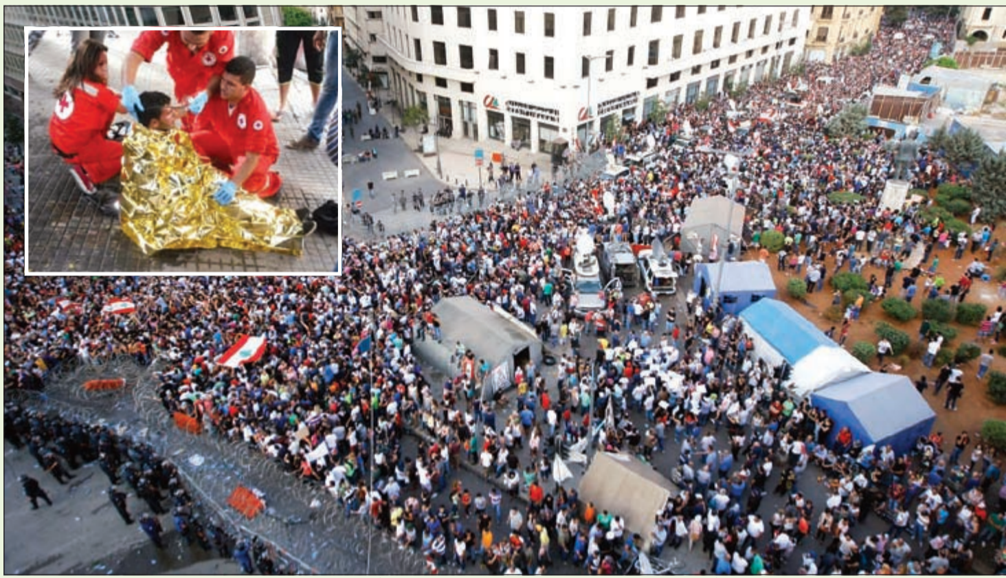
حشود المتظاهرين اللبنانيين الذين تجمعوا وسط بيروت أمس للمطالبة بإسقاط الحكومة وفي الإطار المواطن اللبناني الذي أحرق نفسه في صيدا يتلقى الإسعافات