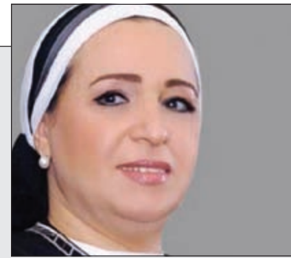
انتصار عامر قرينة الرئيس المصري