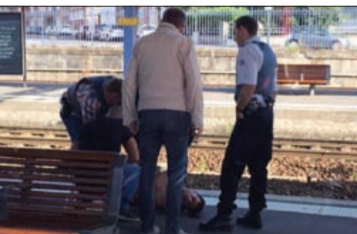
رجال الشرطة يعقلون المسلع على رصيف المحطة في أمستردام

عواصم - وكالات: حال ثلاثة أميركيين وبريطاني واحد دون وقوع «مجزرة» في القطار السريع المتجه إلى باريس من أمستردام أمس الأول بعدما تمكنوا من السيطرة على مسلح فتح النار وأصاب شخصين إضافة إلى احد المهاجمين.