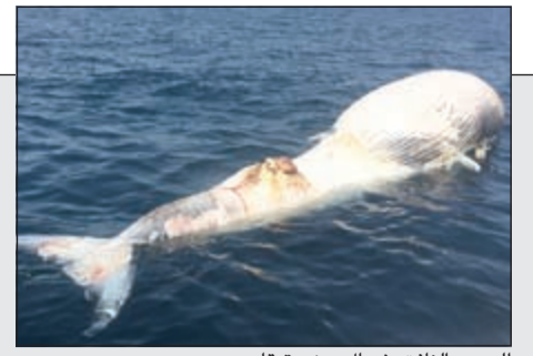
الحوت النافق شمال جزيرة قاروه

الأنباء ترصد مخالفة 'الطب': لا مشرحة جديدة بل توسعة للقديمة و'الفورمالدهايد' المسرطنة تنتشر في الكلية 14