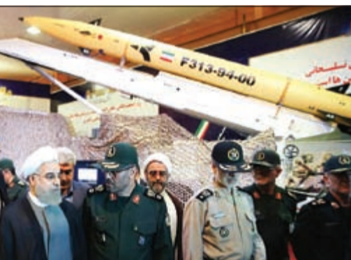
الرئيس الإيراني يكشف النقاب عن الصاروخ الجديد «فاتح 313»

طهران - وكالات: أزاحت إيران أمس الستار عن صاروخ باليستي جديد «بالغ الدقة» يصل مداه إلى 500 كيلومتر. واحتفل الجيش الإيراني بـ «اليوم الوطني للصناعات الدفاعية» بالكشف عن صاروخ أرض-أرض من طراز «فاتح 313»، بحضور الرئيس حسن روحاني. وقالت وسائل الإعلام الإيرانية إنه يمتاز «بخفة الوزن ويستخدم فيه الوقود الصلب ويحتوي على مجسات بالغة الدقة»، وبهذا الكشف تتحدى إيران على ما يبدو الاتفاق النووي الموقع مع الغرب والذي ينص على أن أي انتقال لتكنولوجيا الصواريخ الباليستية إلى إيران خلال السنوات الثماني المقبلة يجب أن يكون بموافقة مجلس الأمن، لكن روحاني أكد أن بلاده لن تلتزم بقرارات الاتفاق التي تفرض قيوداً على قدراتها العسكرية.