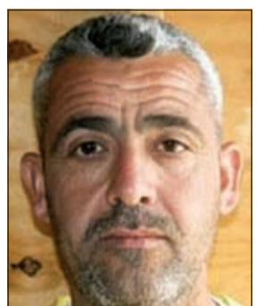
فاضل احمد الحياي (العربية.نت)

واشنطن - وكالات: أعلنت واشنطن أنها وجهت ضربة قوية لتنظيم الدولة الإسلامية (داعش) بقتلها الرجل الثاني بعد أبو بكر البغدادي بالقرب من الموصل في العراق. وقالت الرئاسة الأميركية أن فاضل احمد الحياي، المعروف باسم «الحاج معتز»، أيضاً كان احد المنسقين الرئيسيين لعمليات نقل الأسلحة والمتفجرات والأليات والأفراد بين العراق وسورية. وأضافت أنه «أدى دوراً رئيسياً في تنظيم العمليات خلال العامين الماضيين»، وخصوصاً خلال هجوم التنظيم على الموصل في يونيو 2014.