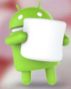
Android 6.0 Marshmallow

ITP.net: أعلنت «غوغل» بشكل رسمي عن إطلاق اسم «مارشميلو» على الإصدار الجديد من نظام تشغيل أندرويد والذي يحمل رقم 6.0، واسمه التجاري بالإنجليزية هو Android 6.0 Marshmallow حيث قامت الشركة العملاقة بوضع تمثال للنسخة الجديدة في حديقة مقر الشركة في كالي فورنيا. ومن المعروف أن «غوغل» تطلق أسماء حلويات ووفق الترتيب الأبجدي على الإصدارات المتلاحقة بنظام تشغيلها الخاص بالهواتف المحمولة، حيث بدأت مع أندرويد 1.5 والذي أطلقت عليه اسم «كب كيك»، ثم اتبعته باندرويد دونات،