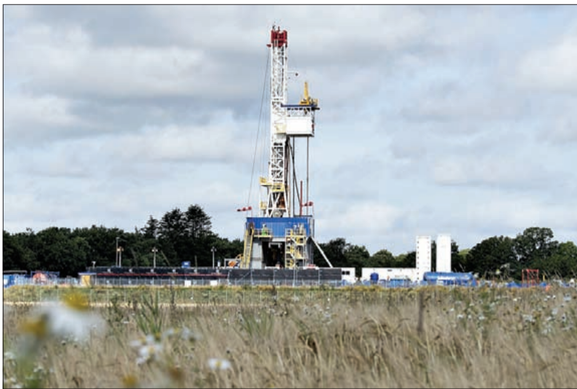
منصة حفر للنفط الصخري في الدمارك تابعة لمجموعة توتال الفرنسية حيث تدخل دول جديدة في السباق على استخراج النفط الصخري مما يشكل ضغوطاً أكبر على أسعار النفط العالمية

أما سوق الأسهم السعودي فلم يكن بعيداً عن هذه الأجواء، حيث هبط المؤشر بنحو 3٪ إلى مستوى 8193 نقطة، بتداولات بلغت قيمتها 3,8 مليارات ريال، وهي بين الأدنى منذ بداية العام، وأحجام 152 مليون سهم. ويأتي هذا التراجع على خلفية توقعات المحللين بانخفاض الطلب الصيني على النفط، حيث تعتبر الصين بين أكبر المستوردين للنفط السعودي (والخليجي عموماً)، وهو أمر سيؤثر على شركات البتروكيمياويات السعودية. وكعادته تأثر سوق الكويت للأوراق المالية بالأسواق المجاورة، ليشهد تراجعاً لليوم الثالث على التوالي، وهبط المؤشر السعدي مسجلاً تراجعاً نسبته 0,02٪ إلى 6194,71 نقطة، خاسراً 1,39 نقطة، وتراجع المؤشر الوزني بنسبة 0,01٪، بالغا 412,41 نقطة، فيما خالف مؤشر «كوبك 15» الاتجاه بارتفاع بنحو 0,33٪، ويصعد 3,22 نقطة إلى 992,98 نقطة. وارتفعت القيم بحوالي