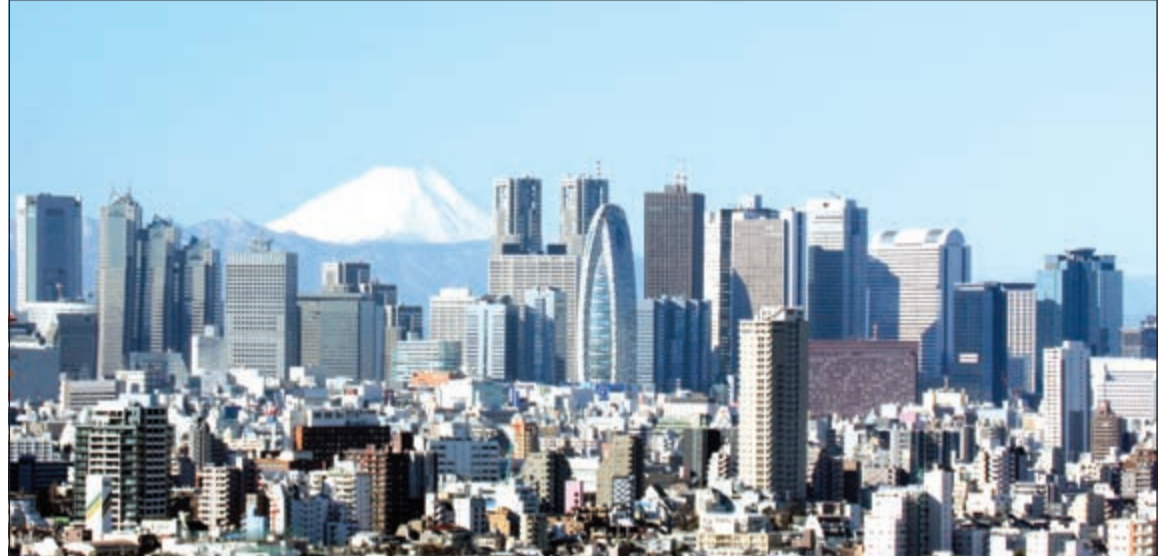
العجز المالي الضخم في اليابان وتراكم الدين تقيدي أي جهود لتعزيز الإنفاق الحكومي

الاعمال، إلا أن العجز المالي الضخم في البلاد، وتراكم الدين تقيدي أي جهود لتعزيز الإنفاق الحكومي. ويقول جونز عبر تقريره: إن الدين الحكومي في اليابان يتجاوز نظيره في اليونان أو في أي دولة من منظمة التعاون الاقتصادي والتنمية، حيث يتجاوز 230٪ من الناتج المحلي الإجمالي للبلاد.