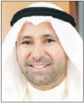
الشيخ عبدالله الجابر

أعلنت شركة تمويل الإسكان عن نتائجها المالية للنصف الأول من العام المنتهي في 30 يونيو 2015، حيث سجلت الشركة ربحاً صافياً مقداره 862 ألف دينار بربحية سهم قدرها 4,42 فلوس للسهم الواحد. وقد حافظت الشركة على حجم الأصول المدارة عند مستوى 48,8 مليون دينار مع الانتهاء من إعادة الهيكلة، وقد استطاعت تحقيق دخل إجمالي من الأنشطة التجارية بقيمة 959 ألف دينار وزيادة مقدارها 35٪ تقريبا عن نفس الفترة من العام السابق. كما قامت الشركة مع بداية العام بالانتهاء كلياً من إعادة هيكلة ديونها بشكل إيجابي، مما كان له أثر بالغ في قدرة الشركة على تحقيق أرقام متميزة في النصف الأول من العام الحالي.